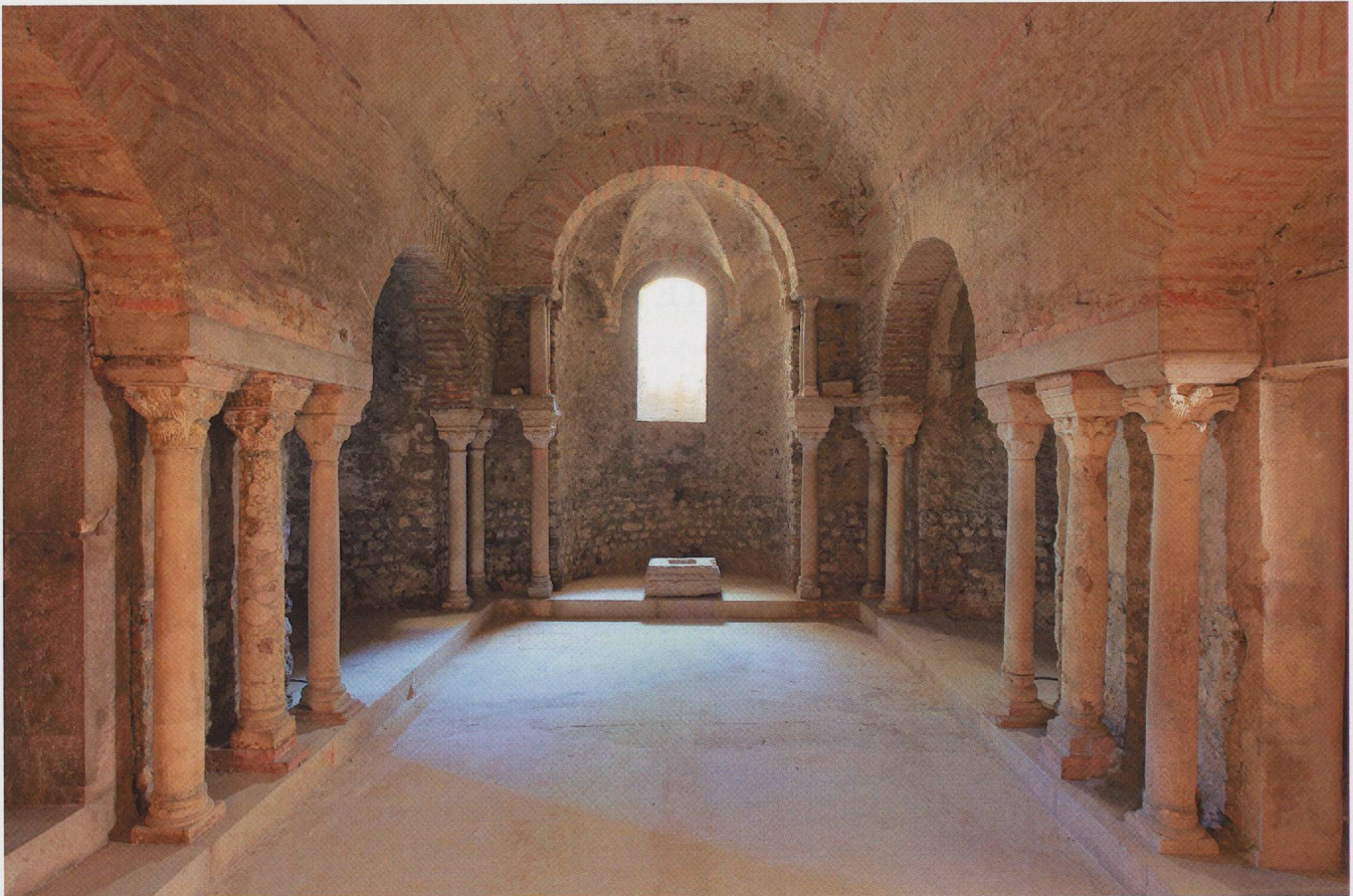
Fig. 1 — La crypte Saint-Oyand (photo Frédérick Pattou).

relevés pierre à pierre où chaque détail d'appareil, de mortier ou d'enduit, est individualisé pour argumenter une interprétation poussée des phases de construction, de réparation ou de reconstruction.