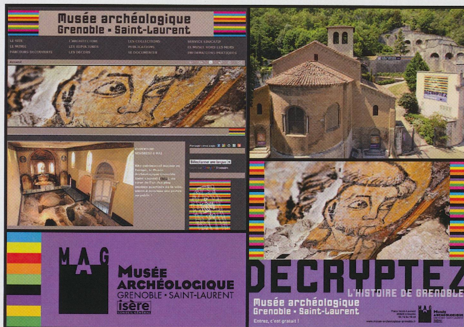
◀ Fig. 6 — Exemples du graphisme créé pour le musée: site web, signalétique, affiche, logo (Jean-Jacques Barelli).

budget non négligeable. En revanche, nous disposons aujourd'hui de la possibilité d'une communication gratuite sur internet: site web, réseaux sociaux, etc. Nous avons constaté son efficacité mais aussi la nécessité de maîtriser l'outil. La liberté sur internet permet à quiconque de présenter votre institution (création d'un site, d'une page sur les réseaux sociaux, etc.). Il est plus facile de prendre les devants que de devoir rectifier l'existant 11 .