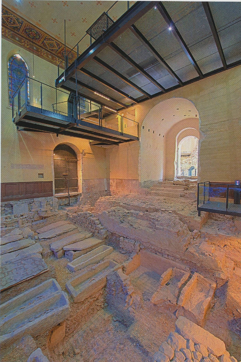
Fig. 3 — La tribune conçue et réalisée par Jean-Louis Taupin, ACMH.