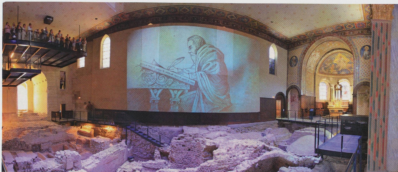
▲ Fig. 5 — Aperçu de la scénographie dans la nef de l'église Saint-Laurent conçue par Jean-Noël Duru.