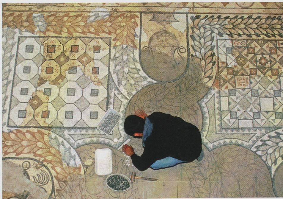
Fig. 3 — La restauration des pavements polychromes. Le choix d'un procédé de réintégration non colorée à l'aide de tesselles modernes. Réalisation Raymond Rogliano et Michel Compan.

Trois méthodes de réintégration du décor, des tracés comme des aplats, ont été mises en œuvre. Pour les compositions les plus lacunaires, lorsque l'étude raisonnée des mosaïques n'avait pu aboutir à une conclusion définitive, l'intervention minimale a consisté à combler les lacunes à l'aide d'un mortier synthétique à la surface lissée et riches en inclusions dont l'aspect est proche du béton de tuileau antique. Les grandes lignes de la composition sont alors évoquées à l'aide d'un double filet de tesselles noires et grises. Tout au contraire, pour les pavements les mieux conservés, les lacunes sont comblées à l'aide de tesselles de débitage moderne (fig. 3). La continuité avec le tesselatum est assurée, mais aucune confusion entre le document original et l'intervention de restauration ne peut subsister dans l'esprit du visiteur. N'ont