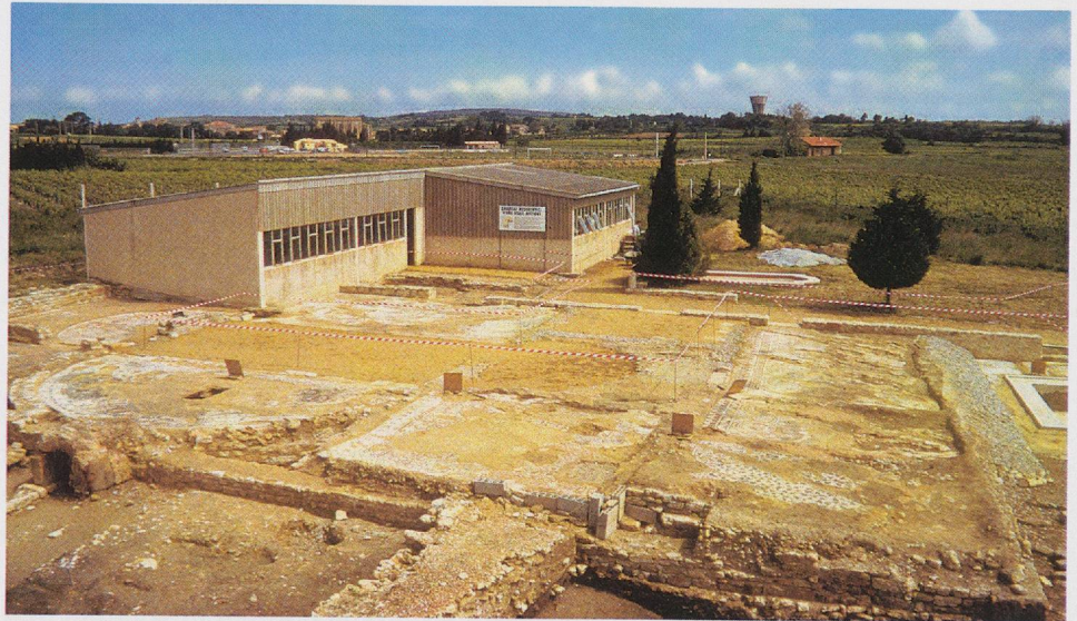
Fig. 2 — Le site archéologique en 1988, lors de l'étude préalable Monument historique.

dont les effets protecteurs ne sont pas toujours avérés même en milieu méditerranéen. Cependant, les décideurs publics ont d'autres ambitions et souhaitent faire d'un projet de conservation des pavements sur place, dont l'intérêt scientifique est évident, un atout touristique pour attirer de très nombreux visiteurs et permettre de dégager des ressources nouvelles. Dans les années soixante, la démarche est originale pour le patrimoine antique en Languedoc-Roussillon, mais participe d'une réflexion plus large sur le devenir économique de la région, au moment où les grandes stations balnéaires sont en chantier.