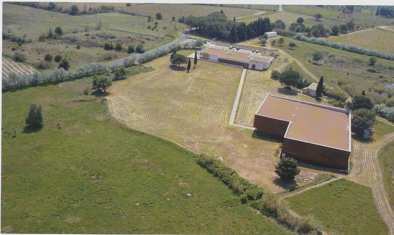
Fig. 4 — Le musée de site aujourd'hui. Dans un espace foncier public correspondant à l'emprise du site archéologique, au premier plan le bâtiment de protection de la résidence de l'Antiquité tardive; en arrière-plan, le bâtiment d'accueil.

Ce bâtiment de 500 m 2 est affecté pour une partie à l'administration du site et aux équipements d'accueil du public; il constitue d'autre part le point de départ de la visite, avec un hall d'accueil qui offre un point de vue privilégié sur l'étang de Thau. Deux salles font office d'espace muséographique, dont la visite est un préalable à la découverte des mosaïques. Une troisième salle est dédiée aux expositions temporaires, mais de façon plus usuelle aux ateliers pédagogiques, aux conférences et manifestations scientifiques.