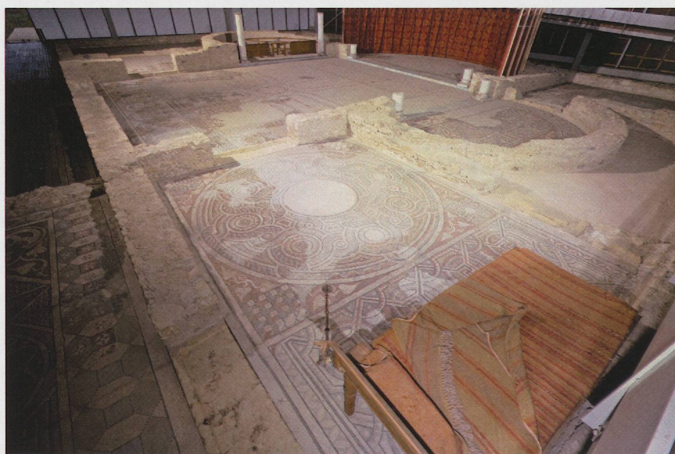
Fig. 5 — Les mosaïques restaurées selon divers degrés d'intervention sont replacées in situ , dans le cadre architectural des appartements résidentiels du début du v e s. Des compléments muséographiques ont été apportés en quelques points, tentures et pièces de mobilier (Michel Olive, DRAC PACA, Service régional de l'Archéologie).

Le volume intérieur est entièrement dégagé, éclairé pour l'essentiel en lumière artificielle zénithale. Seule la façade méridionale est ajourée, mais l'effet d'une lumière trop vive est limité par des stores. On a cherché à concilier une vision d'ensemble des pavements comme une vue rapprochée des motifs des mosaïques. Le circuit de visite tente de répondre au mieux à ce double objectif. Le visiteur emprunte une branche du péristyle puis un escalier qui le conduira à un point de vue panoramique à quatre mètres de hauteur. Il chemine ensuite sur une passerelle périphérique, qui le ramènera jusqu'au niveau du sol, pour observer les détails des pavements. Ce dispositif est adapté à des visites de groupes et permet l'accès aux personnes à mobilité réduite en utilisant le dispositif en pente douce.