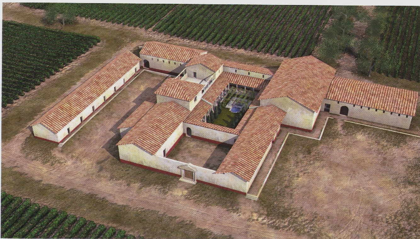
Fig. 7 — Les ressources du site internet www.villa.culture.fr , dédié à Loupian et aux villas de la Gaule romaine. À partir des restitutions scientifiques conçues par Robert Thernot (Institut National de Recherches Archéologiques Préventives), il a été décidé de proposer pour le grand public des évocations de chaque période architecturale de la villa (ici, l'état du Haut-Empire) (Stéphane Cugnet, LaForme).

pas été utilisées jusque-là. Elles pourront être complétées par les acquis des fouilles préventives conduites sur d'autres villas par l'équipe de Loupian. Ces résultats demandent à être exploités grâce aux plus récentes technologies du numérique. À l'occasion des Journées nationales de l'Archéologie, en mai 2011, le ministère de la Culture et de la Communication a mis en ligne un nouveau volume de la collection Grands sites archéologiques: Villa, villae en Gaule romaine . Villa-Loupian en Languedoc www.villa.culture.fr . Ce travail a été une opportunité pour amorcer une réflexion sur l'intégration de nouveaux outils dans une muséographie renouvelée (fig. 7). Le challenge de la construction d'un musée de site a été passionnant. Ce nouveau chantier qui s'ouvre le sera tout autant.