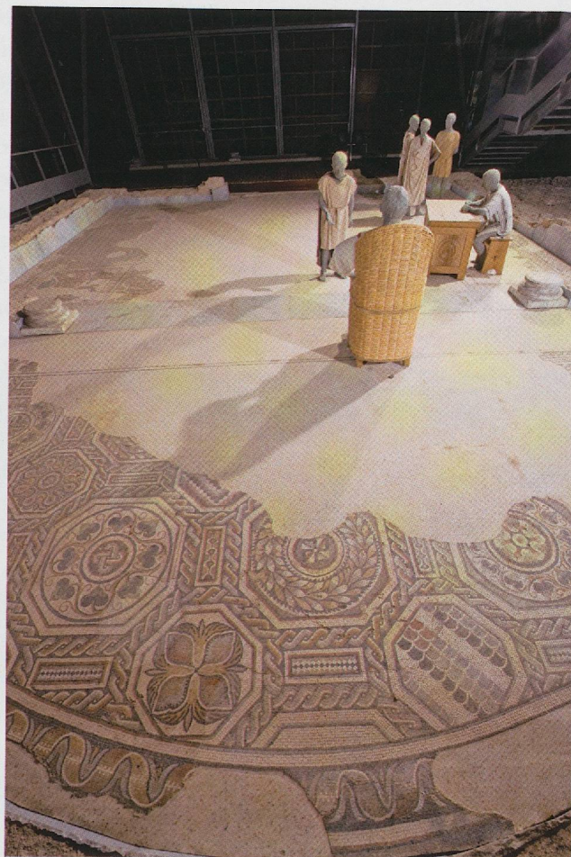
Fig. 6 — La scène du propriétaire recevant ses colons dans l'une des pièces d'apparat, suggérer l'Antiquité tardive au-delà des vestiges archéologiques.