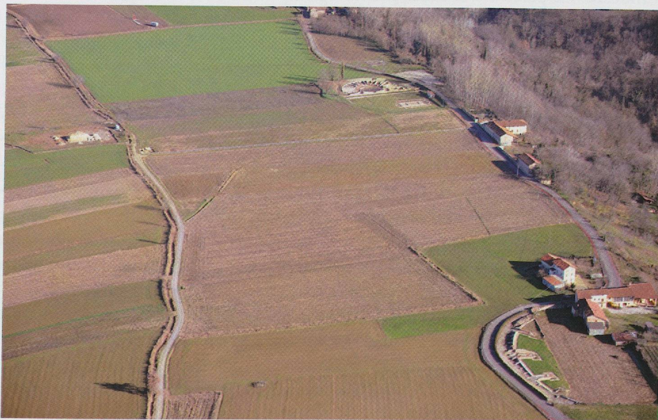
Fig. 1 — Panoramica della Piana della Roncaglia con i resti della città romana di Augusta Bagiennorum.