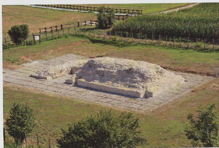
Fig. 5 — Panoramica dell'area archeologica con il podio del tempio a conclusione degli interventi.

rimangono ancora da esplorare (fig. 4). Il risultato delle indagini, condotte tra il 2001 e il 2003, ha confermato la costruzione dell'edificio su un terrapieno artificiale. La cavea, di forma ellittica (m 105,60 x 77), è risultata delimitata da un muro perimetrale cui si addossavano all'esterno una serie di contrafforti posti a distanza regolare che sostenevano un prospetto ad archi. Avancorpi ad U erano destinati agli scalini in laterizi, ancora conservati, per accedere alle gradinate dell'ordine superiore, presumibilmente in legno, mentre un corridoio in parte voltato, conduceva a quelle inferiori. I pochi materiali rinvenuti nello scavo, soprattutto monete in bronzo (assi di Antonino Pio, Faustina II e un sesterzio di Adriano), indicano l'utilizzo del monumento, costruito dopo la metà del I d.C., per tutto il II secolo.