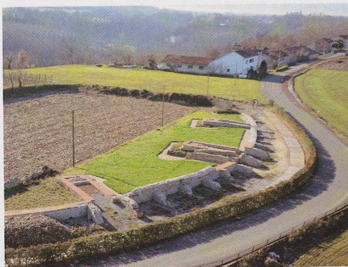
Fig. 4 — Panoramica dell'anfiteatro.