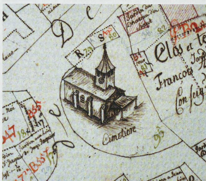
Fig. 25. Démoret, le temple et son cimetière selon le plan cadastral de 1730 (ACV).

Trois caractéristiques distinguent fondamentalement les cimetières de l'Ancien Régime de ceux des siècles suivants : la localisation, la structure et l'usage. Ces critères sont