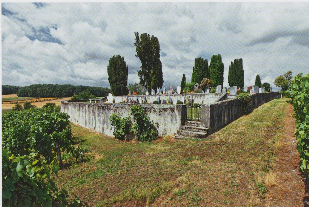
Fig. 27. Aclens, cimetière caractéristique avec ses murets et sa végétation sempervirens.

les sépultures dans les lieux de culte et va même jusqu'à ordonner l'éloignement des cimetières qui devront désormais se situer au-delà des enceintes des agglomérations françaises 17 . Sur ce point, le Canton de Vaud tarde à se mettre à jour puisqu'il faut attendre le 16 janvier 1812 pour voir la première véritable loi cantonale portant sur la police des enterrements. Cet arrêté du Petit Conseil constitue un véritable tournant dans la topographie funéraire vaudoise; il contribue à redéfinir aussi bien la localisation, la structure que l'usage des cimetières. Dès lors, «aucun cimetière ne peut être établi dans l'enceinte d'une Ville ou d'un village» 18 ; de plus, tout cimetière devra être tenu clos et ne servira à aucun «autre usage qu'à enterrer les morts» 19 . Si les exemples étudiés montrent que ces dispositions tarderont à être appliquées systématiquement, sans doute parce qu'ils relèvent de la responsabilité des communes, la dynamique de transformation du paysage cémétériel vaudois est cependant lancée. En outre, de décennie en décennie, des articles de loi de plus en plus détaillés sont votés en vue de compléter ou de corriger certains aspects de la police des enterrements, notamment pour ce qui relève de l'hygiène. A titre d'exemple, la loi sur les inhumations du 25 mars 1834 précise que le sol choisi en vue d'installer un cimetière ne doit pas être humide afin de pouvoir y creuser «des fosses de six pieds de profondeur» 20 . Le même arrêté