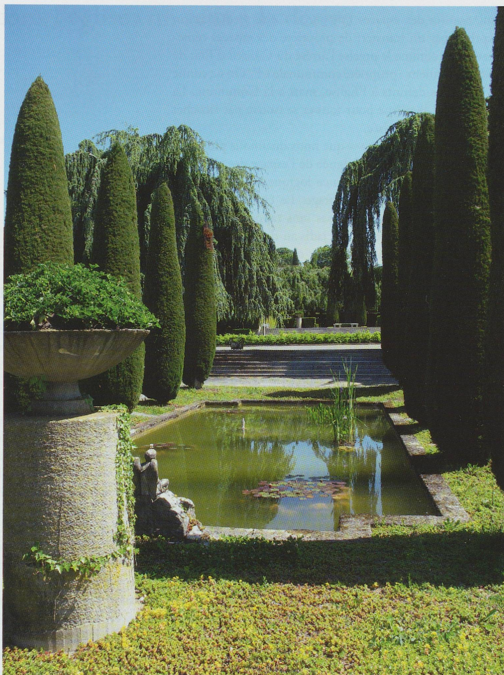
Fig. 28. Lausanne, cimetière du Bois-de-Vaux, allée latérale avec bassin, vasque et cyprès.

cimetière de Villars-Burquin, véritable belvédère ouvert sur le bassin du lac de Neuchâtel. A cette inscription topographique s'ajoute un aménagement végétal sempervirens qui contribue à caractériser le cimetière protestant. Tous ces éléments tendent à lui conférer une image de plus en plus normalisée, mais souvent en quête de pittoresque et non dénuée de romantisme. Cette vision romantique conditionne d'ailleurs notre perception actuelle du cimetière, avec ses mystères, ses ambiances, ses légendes.