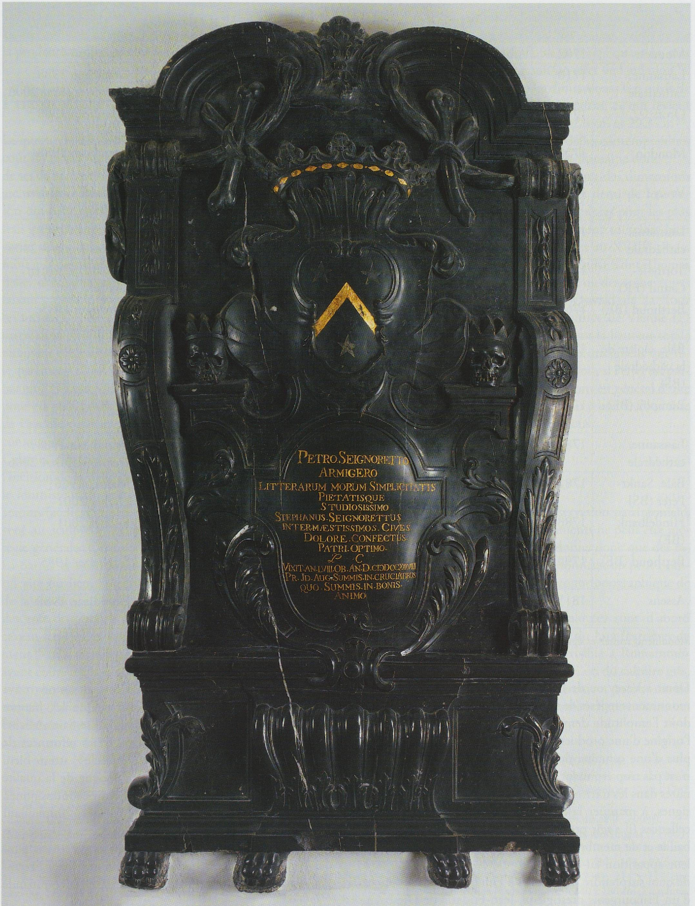
Fig. 41. Vevey, église Saint-Martin, monument de Pierre Seignoret († 1738) (Photo Laurent Dubois).