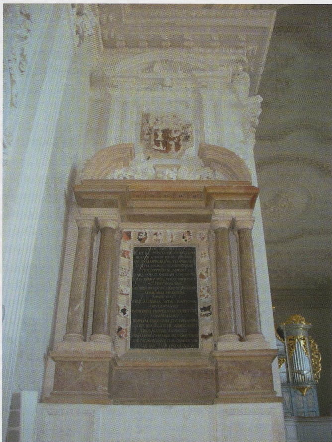
Fig. 131. Porrentruy, église des jésuites, monument de Jakob Christoph Blarer von Wartensee († 1608).