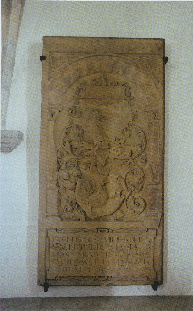
Fig. 136. Porrentruy, église Saint-Germain, dalle de Jean de Tavanne († 1549) (Photo Karina Queijo).

brisé qui intègre les armoiries du défunt et dont les parties latérales sont ornées d'armes drapées.