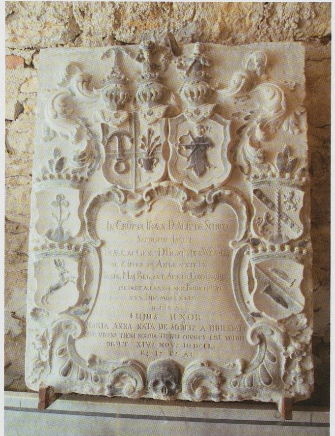
Fig. 135. Porrentruy, église Saint-Pierre, monument funéraire d'Albrecht von Schütz († 1744) (Photo Maya Birke von Graevenitz).

Knorpelstil et au Rollwerk 32 , les masques grotesques qui soutiennent les colonnes, la composition architecturée ainsi que la dimension considérable du monument font écho au monument d'Anastasia Blarer von Wartensee. D'ailleurs, il fut également entouré de part et d'autre d'un large décor de peinture murale, qui souligne la continuité typologique entre les deux réalisations.