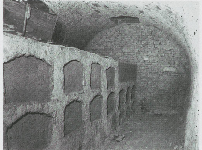
Fig. 133. Porrentruy, église Saint-Pierre, caveau Saint-Michel contenant les dépouilles mortelles des onze princes-évêques (Office du patrimoine historique de Porrentruy).

A première vue, la monumentalité de ces œuvres peut paraître démesurée pour l'église des jésuites. En effet, leurs dimensions et leur plasticité permettent de les comparer à certains grands monuments d'archevêques réalisés pour des cathédrales à la fin du XVII e siècle. A Mayence par exemple, le monument de l'archevêque Damian Hartard von der Leyen réalisé par le sculpteur Arnold Harnisch en 1686 affiche une composition architecturée à colonnes et à fronton circulaire brisé qui présente plusieurs similitudes avec les réalisations bruntrutaines 24 . Là aussi, l'architecture a pris le pas sur l'ornementation et occupe une surface