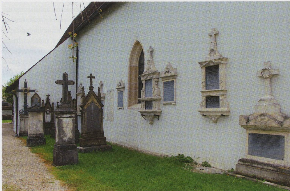
Fig. 137. Porrentruy, église Saint-Germain, vue de la paroi nord du sanctuaire.

de Billieux d'Ehrenfeld, de Joseph-Bernard de Billieux, d'Aloys-Joseph-Melchior de Billieux et de Joseph-Xavier-Dominique Nizole, défenseurs fidèles de l'ancien évêché de Bâle. Leurs monuments, grâce à leur positionnement géographique, leur composition tripartite ainsi que leur programme ornemental, traduisent la volonté de se réclamer d'une tradition formelle qui connut ses heures de gloire à l'époque des princes-évêques; par ces formes, les défunts expriment en quelque sorte leur attachement à l'ancien évêché.