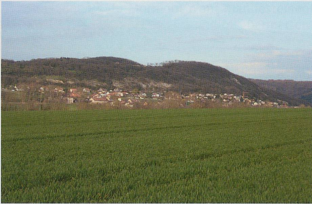
Fig. 342 La colline du Mormont vue de la vallée de la Venoge, au sud.

drainé par le Nozon, ouverte sur le lac de Neuchâtel au nord (vers le Rhin) et la vallée de la Venoge, qui se jette dans le Léman, au sud (vers le Rhône). L'absence de toutes traces de fortification et de mobilier dans les zones labourées en contrebas des terrasses où sont installées les fosses ne permet pas de conclure à l'existence d'un oppidum, mais aucune prospection systématique n'a encore été réalisée à ce jour.