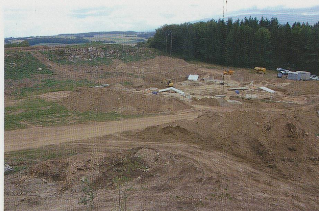
Fig. 341 Vue de la zone A du site lors de la première campagne de fouille en juin 2006.

à Gournay-sur-Aronde, mais qui l'est ailleurs), mais aussi pour le chien ou les caprinés, qui peuvent figurer dans l'une ou l'autre catégorie selon, entre autres, la chronologie. Or, au Mormont, tous les animaux (à l'exception du chien, très peu abondant) figurent dans ces deux grandes catégories, et l'on trouve aussi bien des chevaux consommés que des porcs qui ne l'ont pas été, et tous les animaux sont également représentés sous forme de carcasses. Même si leurs contributions respectives à ces diverses formes de pratiques ne sont pas égales, cela va à l'inverse des observations habituelles sur le statut des animaux domestiques dans les communautés celtiques, et notamment lors de leurs sacrifices.