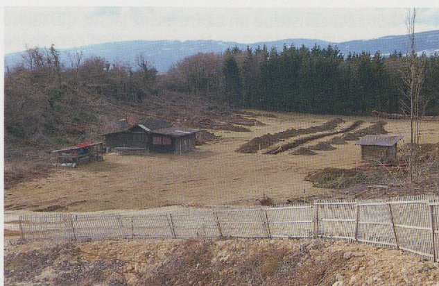
Fig. 340 Vue de la zone A du site lors du diagnostic réalisé par Archeodunum en février 2006.