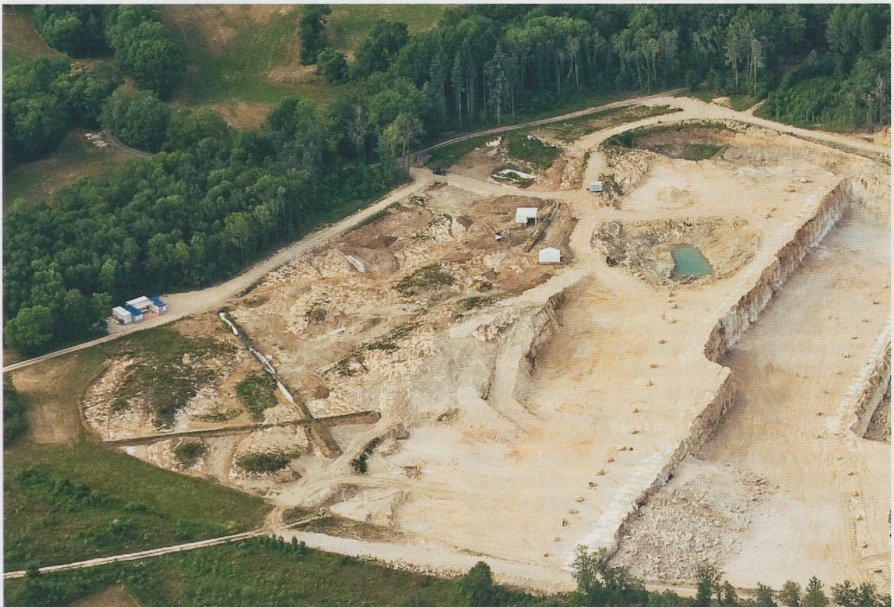
Fig. 344 Le site durant l'été 2010, avec la dépression en eau qui correspond à la zone A.

Les fosses qui n'ont pas atteint l'eau, ou qui ont été tariées faute d'une nappe pérenne, auront été les premières utilisées comme lieu de dépôts. C'est dans ces dernières que l'on trouve des restes de repas collectifs de grande ampleur, les parties des animaux découpés étant réparties entre diverses fosses, ce qui