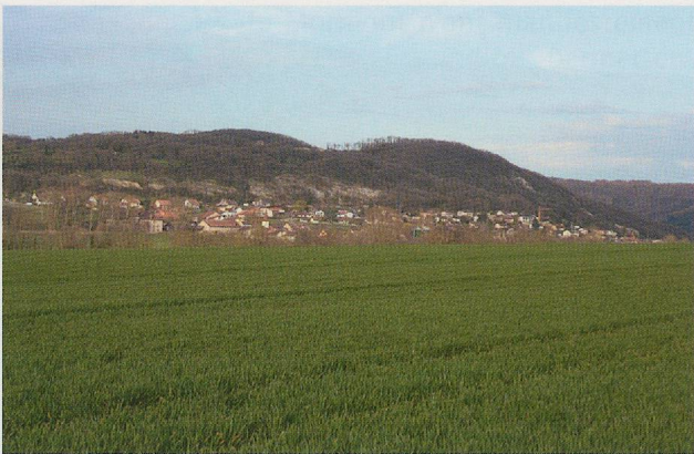
Fig. 342 La colline du Mormont vue de la vallée de la Venoge, au sud.

drainé par le Nozon, ouverte sur le lac de Neuchâtel au nord (vers le Rhin) et la vallée de la Venoge, qui se jette dans le Léman, au sud (vers le Rhône). L'absence de toutes traces de fortification et de mobilier dans les zones labourées en contrebas des terrasses où sont installées les fosses ne permet pas de conclure à l'existence d'un oppidum, mais aucune prospection systématique n'a encore été réalisée à ce jour.