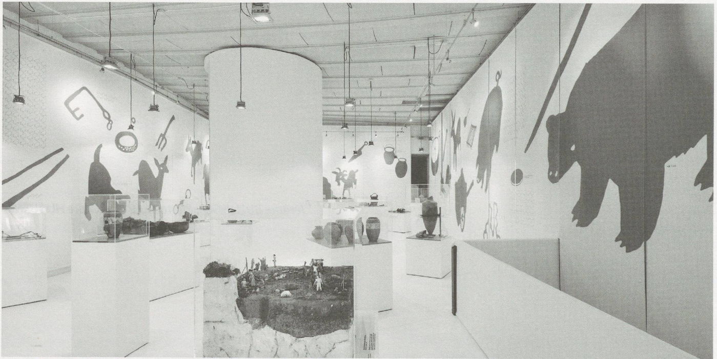
Vue de l'exposition «Les Helvètes au Mormont», du 11 avril au 19 octobre 2014, au château de La Sarraz.

complémentaires : l'archéologie et l'histoire, évidemment, mais également l'ethnographie, l'égyptologie et les sciences de l'Antiquité, entre autres.