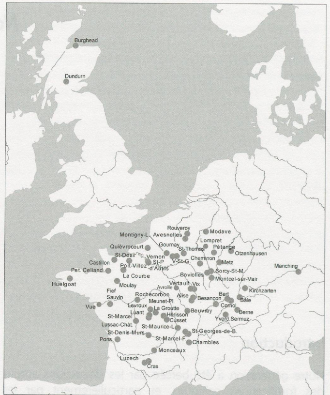
Fig. 1. Carte des sites ayant livré des fiches de murus gallicus .

Le rapprochement entre les remparts à poutrage interne et la description du murus gallicus de Bourges par César a été définitivement accepté par les milieux scientifiques dans les années 1868 après les fouilles de Murcens (commune de Cras, Lot), de Vertault et de Bibracte en Bourgogne. Les découvertes se multiplient dans les décennies suivantes. La présence de longues fiches en fer est souvent signalée, bientôt elle constitue une sorte de signature de l'existence d'un murus gallicus , même si le rempart n'a pas été fouillé. Leur abondance et leur taille étonne les inventeurs. Parfois elles sont connues des agriculteurs qui en font des outils. Dans son inventaire de 1957, M. A. Cotton relève une vingtaine de sites qui ont livré des fiches en fer (Cotton 1957). Aujourd'hui, nous en connaissons soixante deux. La carte que nous avons dessinée montre immédiatement que les limites de la répartition publiée par M. Cotton n'ont presque pas changé (fig. 1). On relève une extension vers la haute Normandie, la Belgique et le Sud-ouest de la France avec l' oppidum de Pons. Zarten et Manching restent isolés sur la rive droite du Rhin ; des exemples plus orientaux proposés en 1957, par exemple Zidovar, à l'époque en Yougoslavie, n'ont pas été confirmés. Ni le Midi de la France, ni l'Espagne, n'ont participé à cette mode, alors qu'on connaît dans ces régions des remparts à poutrage interne. Le phénomène est donc