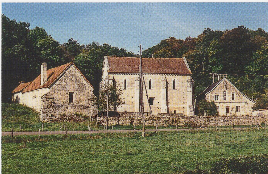
Fig. 4 - La Courroirie (maison-basse), vue d'ensemble.