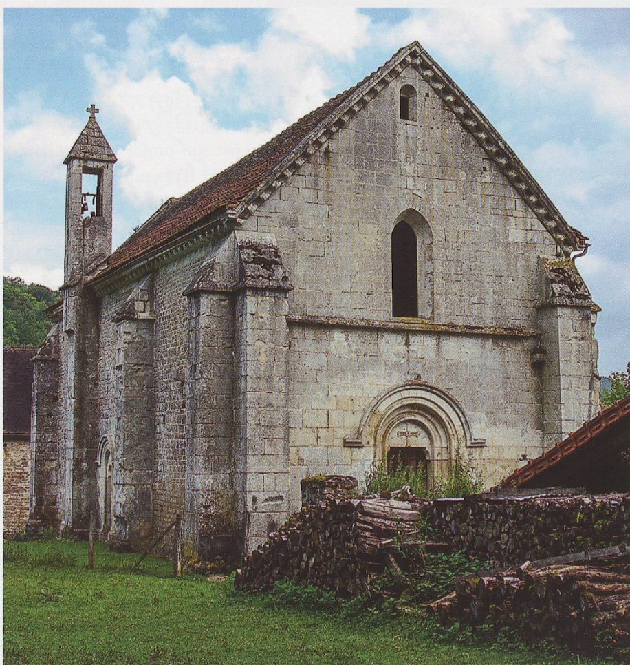
Fig. 5 - La Courroirie (maison-basse), chapelle, façade et mur gouttereau nord.

Ce territoire va rapidement se préciser pour faire apparaître un espace assez inégalement réparti de part et d'autre de la vallée de l'Ource, qui constitue entre Langres et Châtillon-sur-Seine la seule véritable voie naturelle traversant le plateau d'est en ouest et par là-même le principal axe de communication et de fixation de l'habitat. En toute logique, les premiers centres de peuplement et d'exploitation cartusiens se trouvent