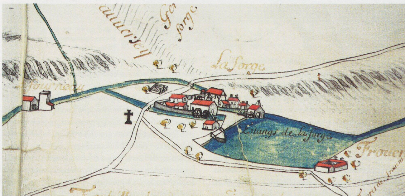
Fig. 10 - Plan des bois (1688), détail: métairie et forge de Froidvent.

Ainsi, en dehors des sites encore « vivants » (Grande-Chartreuse) ou muséifiés (Villeneuve-lès-Avignon) et en dépit de la perte de ses deux cloîtres – repères architecturaux identitaires s’il en est – qui lui coûte sans doute un certain renom, la chartreuse de Lugny demeure malgré tout un des rares sites témoins assez complets de la vie cartusienne médiévale. Par son patrimoine bâti tout d’abord (maison-haute, maison-