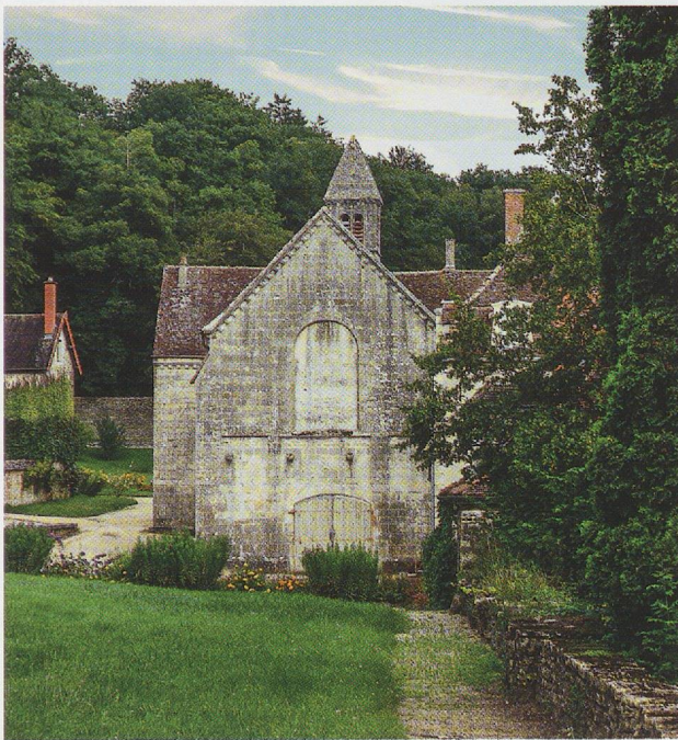
Fig. 3 - Chartreuse de Lugny, maison-haute, église.

déjà donné auparavant un moine du nom de Chrétien à Longuay, cet ancien hospice de chemin, érigé en abbaye cistercienne en 1150, s'est alors trouvé possessionné dans les proches environs au point d'y développer une grange, Valverset (fig. 9) 9 . L'évêque intervient et parvient dès 1175-1176 à convaincre les cisterciens d'abandonner leur domaine déjà en activité au profit des chartreux, moyennant compensation: une grange de valeur au moins équivalente bien que plus éloignée, Grandbois, située 15 km au sud 10 . Entre temps, en 1174, ont abouti des tractations avec un troisième protagoniste, le Temple, ancré de longue date à Bure