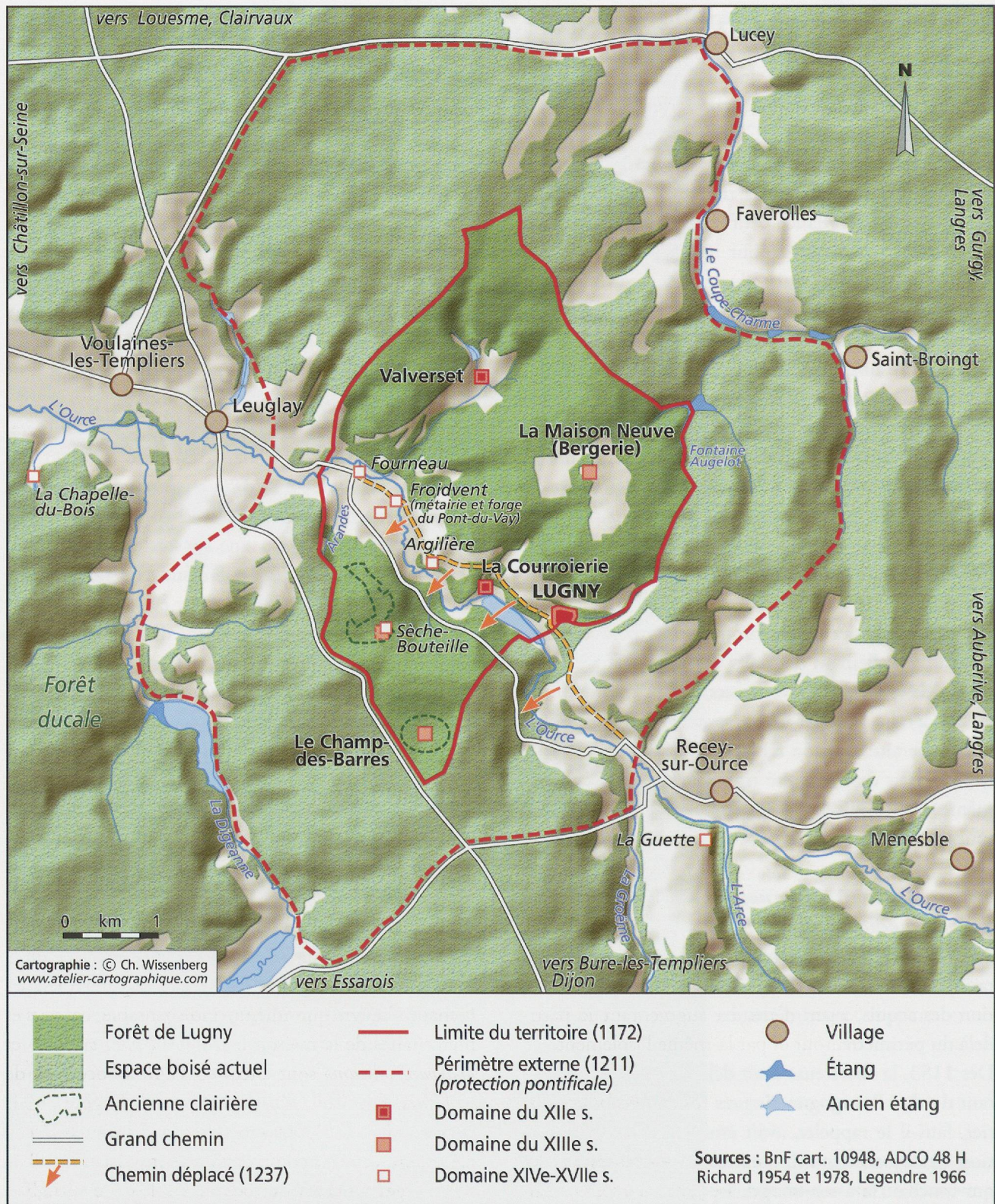
Fig. 6 - L'espace monastique de la chartreuse de Lugny (XIF-XVIII e s.).

tout lieu, de l'espace délimité. Ce dernier, au contraire, est resté incomplètement maîtrisé, surtout sur ses marges, grevé de contraintes d'usages voire d'enclaves juridiques non résorbées. Nombre d'actes rappellent des transactions relatives à l'entreprise de simplification de l'enchevêtrement des droits et propriétés, notamment par le biais d'échanges de parcelles. L'exemple le