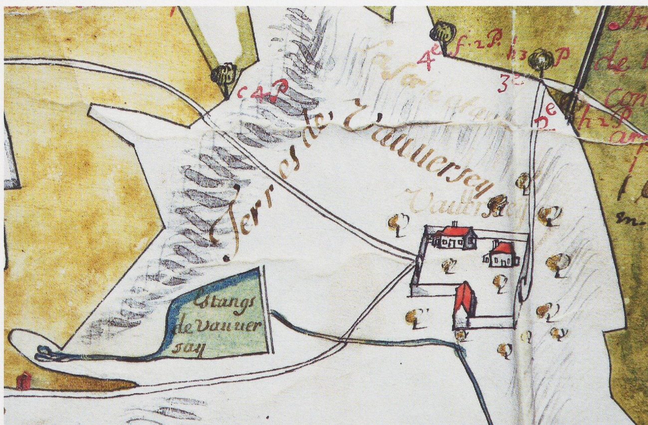
Fig. 9 - Plan des bois (1688), détail: grange de Valverset.