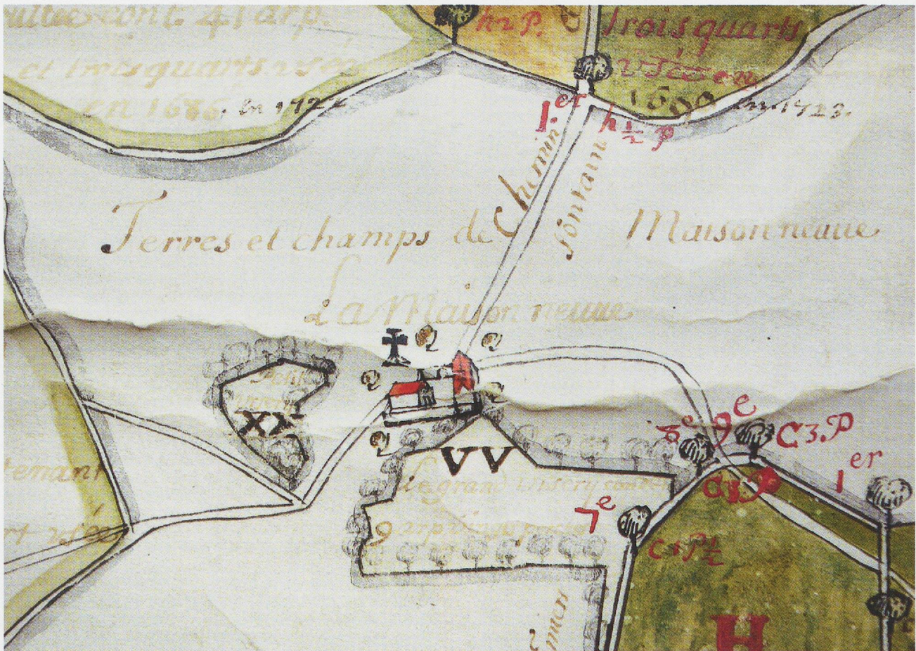
Fig. 11 - Plan des bois (1688), détail: grange de Maison-Neuve.