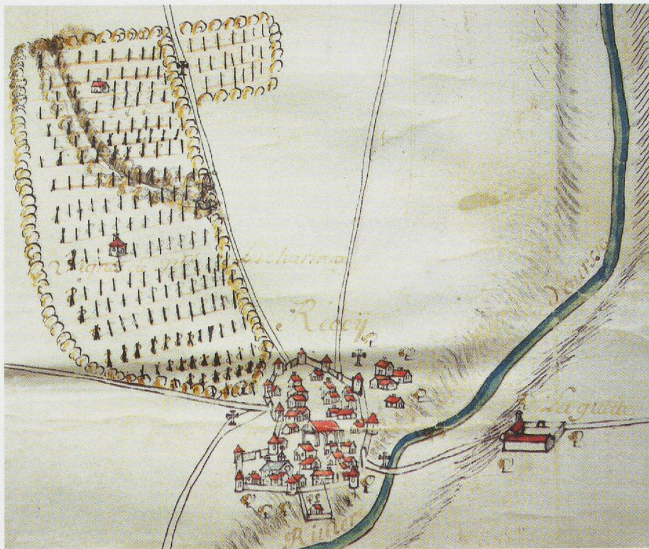
Fig. 12 - Plan des bois (1688), détail: bourg de Recey et métairie de la Guette.