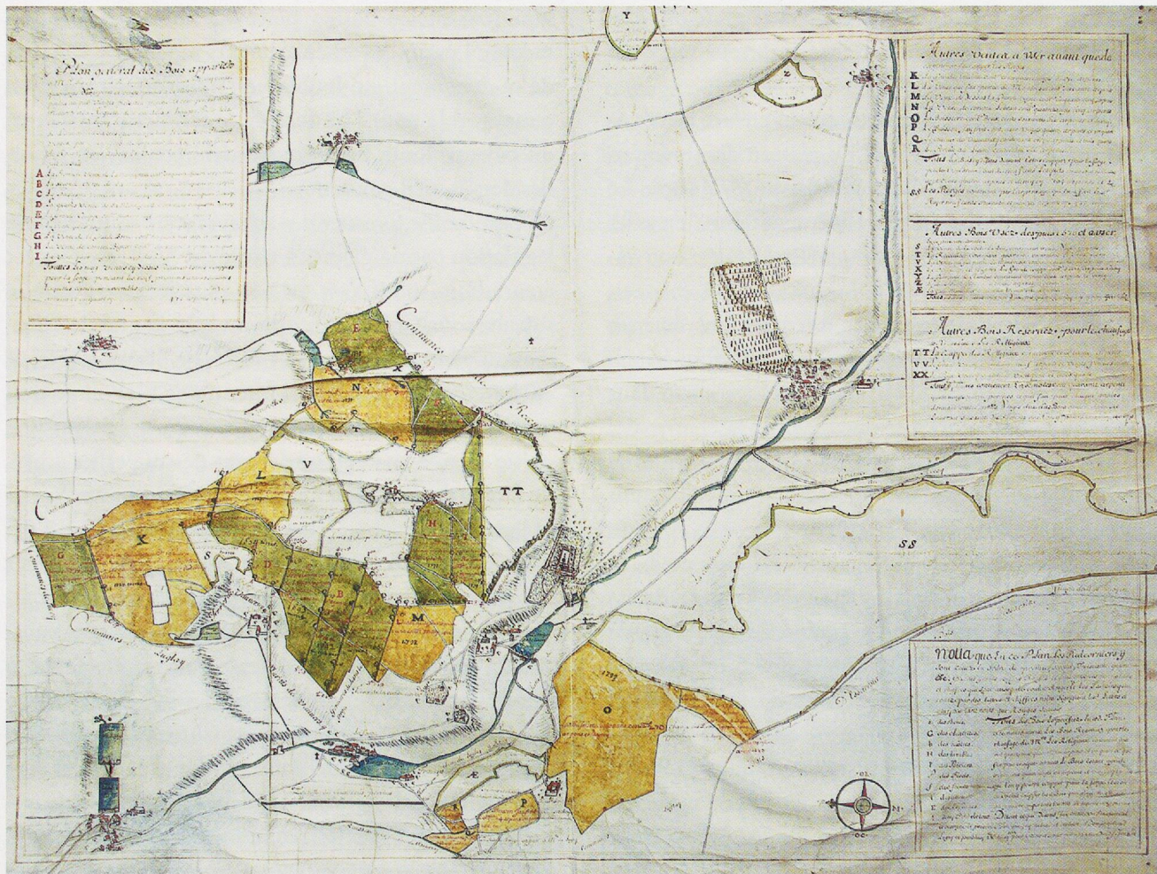
Fig. 7 - Plan des bois (ADCO, 48H20, 1688), ensemble.

en témoignent. Le bourg de Recey est encore présenté avec une densité moindre d'habitations mais avec son enceinte ponctuée de tours et de portes, son église bien localisée, sa halle, son petit faubourg et ses croix de chemins. De même les clos de vignes apparaissent-ils avec leurs rangs de ceps et leurs cadoles, petits édicules servant d'abri au vigneron et à son matériel (fig. 12). Les étangs quant à eux, que le bleu foncé fait clairement ressortir par le truchement d'un ombrage latéral, montrent des chaussées bien nettes, dotées de vannages clairement identifiables. Les cours d'eau observent logiquement les mêmes caractéristiques. Critère supplémentaire de fiabilité, les chemins forment un réseau dense dont les principaux itinéraires sont toujours observables sur les cartes topographiques actuelles. Ce degré de qualité suffirait déjà en soi à considérer ce plan comme un document de premier ordre, et pourtant son intérêt majeur est ailleurs, bien que dans le prolongement de ce qui précède. Il comporte en effet la représentation précise de toutes les granges et métairies de Lugny et surtout la seule élévation réaliste connue de la chartreuse dans son état que l'on peut