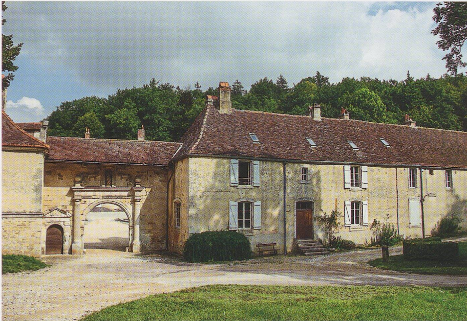
Fig. 2 - Chartreuse de Lugny, maison-haute, porterie.