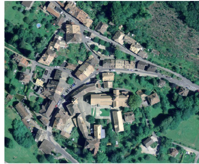
Fig. 246 Plan cadastral (éch. 1:2000) et vue plongeante sur le site.