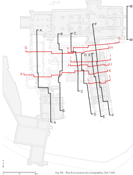
Fig. 245 Plan de la situation des stratigraphies, Ech. 1:500.