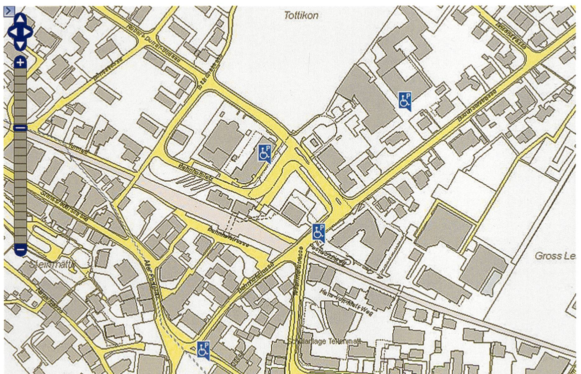
Abb. 1: Darstellung der Autoparkplätze für Rollstuhlfahrerinnen und Rollstuhlfahrer auf Basis der AV-Daten

Naheliegenderweise fanden die Projektinitiatoren mit der IGS eine geeignete Partnerorganisation, um die umfangreiche Erfassung der Rollstuhlparkplätze an die Hand zu nehmen. Die Ingenieur-Geometerinnen und -Geometer nahmen das Projekt zum Anlass, ein eigenes Geschenk für einen guten Zweck für das Jubiläum «100 Jahre amtliche Vermessung Schweiz» in Form der schweizweiten Erhebung der Rollstuhlparkplätze vorzubereiten. Durch die vorgesehene Verwendung der Daten der amtlichen Vermessung als Kartengrundlage im Onlinedienst konnte dem Vorhaben noch zusätzlich Vorschub geleistet werden. Die V+D nahm den Faden ebenfalls auf und sicherte verschiedene Unterstützungen zu. Mit dem Beitrag des EGBG konnte schliesslich die Finanzierung für die Systemaufbauphase gesichert werden. Und dank der Erfassungsarbeit der Rollstuhlparkplätze – auf eigene Kosten – der Ingenieur-Geometerinnen und -Geometer in privaten Büros und öffent-