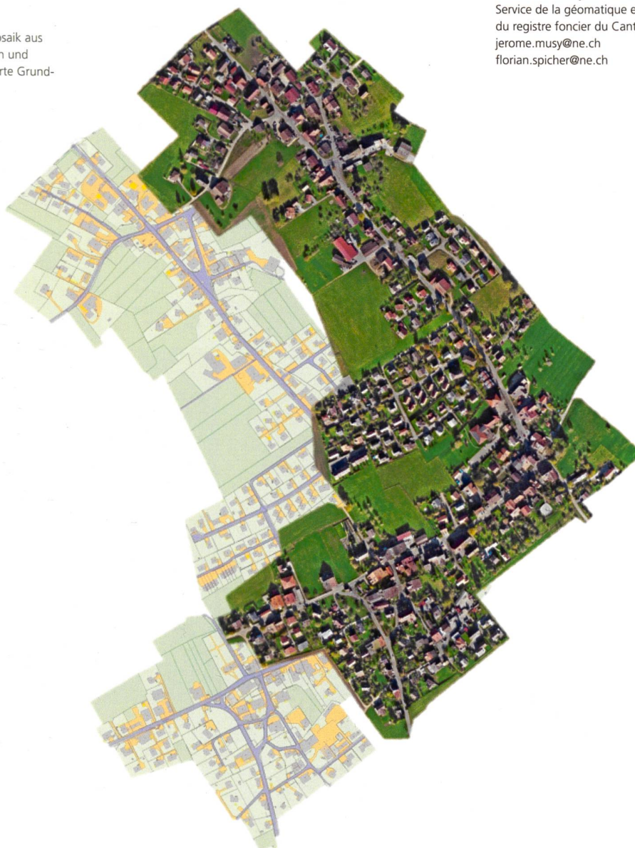
Abb. 1: Orthophotomosaik aus Drohnenbildern und der nachgeführte Grund- buchplan

Jerôme Musy und Florian Spicher Service de la géomatique et du registre foncier du Canton de Neuchâtel jerome.musy@ne.ch florian.spicher@ne.ch