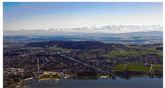
Magglingen, Durchführungsort des Staatsexamens für Ingenieur-Geometer/innen, bietet einen prächtigen Weitblick

Das Staatsexamen findet in den Räumlichkeiten des Bundesamtes für Sport in Magglingen statt.