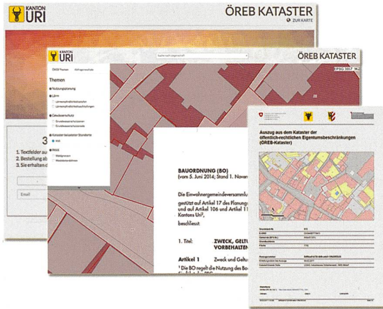
Abb. 2: Prototyp des kantonalen ÖREB-Katasterportals und Prototyp eines ÖREB-Katasterauszugs

Der Zugangsfokus im ÖREB-Katasterportal ist gemäss den Anforderungen des Bundes auf die Suche nach einer Parzelle (ergänzt um Lokalitäten wie Adresse etc.) ausgerichtet. Im Portal werden die Geobasisdaten und die Rechtsvorschriften zusammen mit den Beschlüssen, bezogen auf die ausgewählte Parzelle, zugänglich gemacht. Zusätzlich kann der Auszug aus dem ÖREB-Kataster direkt generiert werden. Projektierte ÖREB-Katasterdaten können optional dazu geschaltet werden.