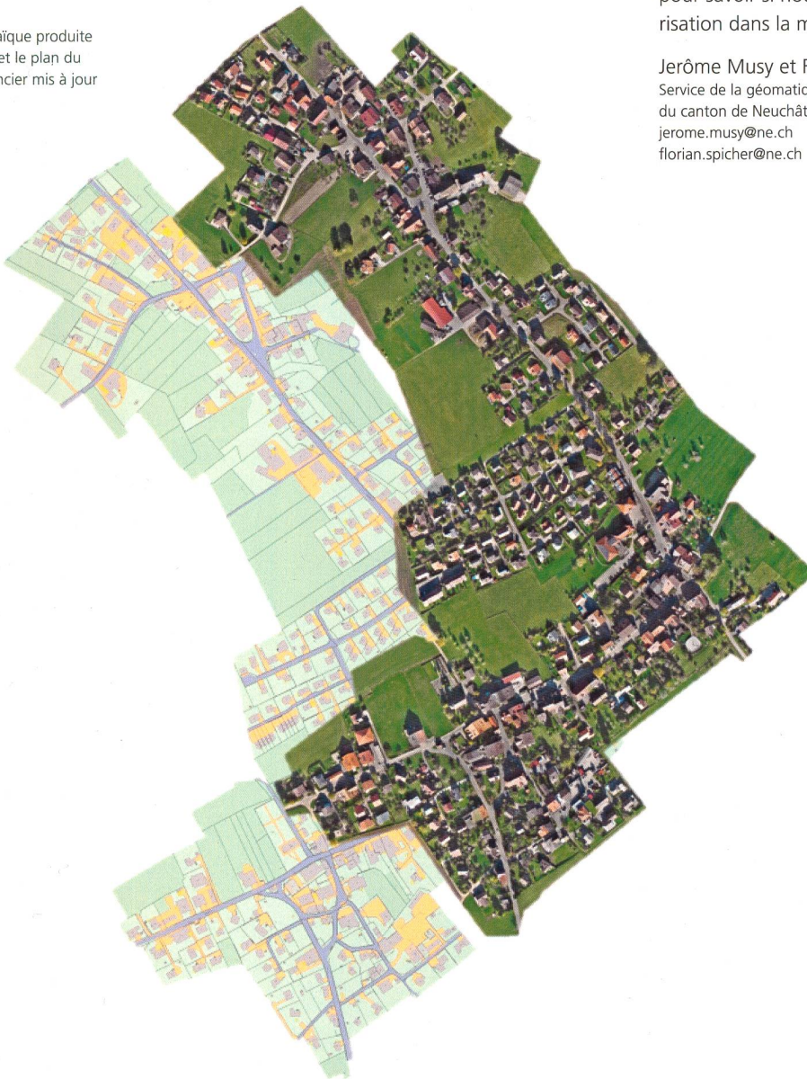
Figure 1: Orthomosaïque produite par drone et le plan du registre foncier mis à jour

Le temps de numérisation par plan folio est de maximum une heure. Ce temps peut être réduit si pendant la pré-analyse un inventaire des zones favorables à la numérisation est établi.