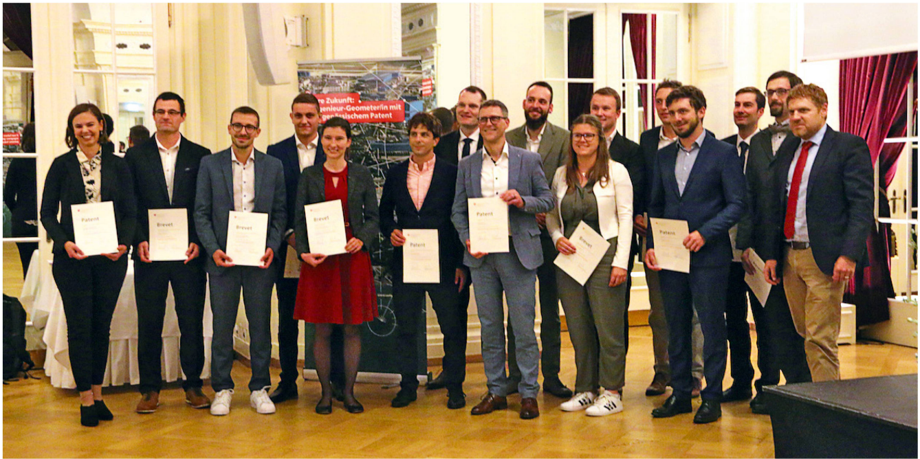
Photo 1: tous les quinze nouveaux titulaires du brevet avec David Varidel, le président de la Commission fédérale des ingénieurs géomètres, tout à droit

La nouvelle promotion compte trois «ingénieures géomètres brevetées» et douze «ingénieurs géomètres brevetés». Après leur réussite à l'examen d'Etat, c'est à Berne, à l'hôtel Bellevue Palace, que le brevet leur a été remis le 12 septembre 2024.