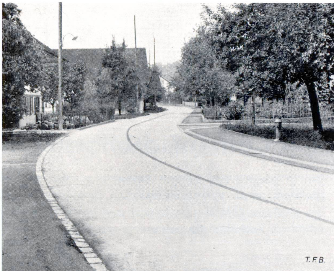
Abb. 1 Möriken (Kt. Aargau), Innerort Durchgang der Ortsverbindungsstrasse Wildegg-Brunegg, erbaut 1937, Breite 5—6 m. Ausführung: Fischer & Co., Baugeschäft, Wildegg

Aus Gründen der Wirtschaftlichkeit wurden Betonbeläge bis jetzt im allgemeinen nur auf Strassen mit schwerem Verkehr ausgeführt; doch nur ungern misst heute der Strassenbenützer die Verkehrssicherheit der Betonstrassen auf den Strassen 2. Klasse und auf den Ortsverbindungsstrassen, wo der Verkehr wohl weniger schwer, die Verkehrsgefahren aber die gleichen sind wie auf den Hauptdurchgangsstrassen. — Der Betonbelag muss also verbilligt werden, was nur möglich ist, wenn er weniger dick gemacht wird. Seit Jahren arbeiteten die Fachleute aller Länder an dem Problem des leichten Strassenbetonbelages und heute sind wir so weit, dass man das Problem als gelöst betrachten kann. Die «Cementschotterstrasse», so genannt nach ihrer Entstehungsgeschichte, erfüllt in weitgehendem Masse die an einen leichten Betonbelag gestellten Anforderungen. Sie ist bedeutend billiger als ihr stärkerer Bruder auf der Fernverkehrsstrasse, besitzt die gleichen guten Verkehrs-