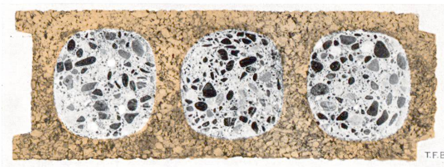
Abb. 1 Querschnitt einer Wand aus Baukork (Beton und Kork) Wärmedurchgangszahl k = 0,45