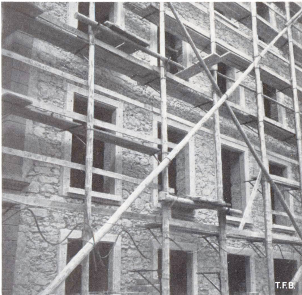
Abb. 6 Renovation — unter dem Verputz tritt ein festes, altes Bruchsteinmauerwerk hervor.

Neben der planmässigen Anlage fällt nun auch eine Einheitlichkeit in Form und Bauweise der verschiedenen Häuser auf. Kaum ein Gebäude zeigte eine grössere Abweichung, die auf einen individuellen Gestaltungswillen des Bauherrn oder des Baumeisters schliessen lässt. Alles ist vom gleichen Model. Nicht nur das, diese Grundbauart scheint von Stadt zu Stadt zu wechseln. Fast jeder Ort hat seine typische Hausform. Diese stilistische Einheitlichkeit der Häuser einer Altstadt und deren kleinere und grössere Differenzierung zwischen Ort zu Ort, muss uns Baufachleute erstaunen,