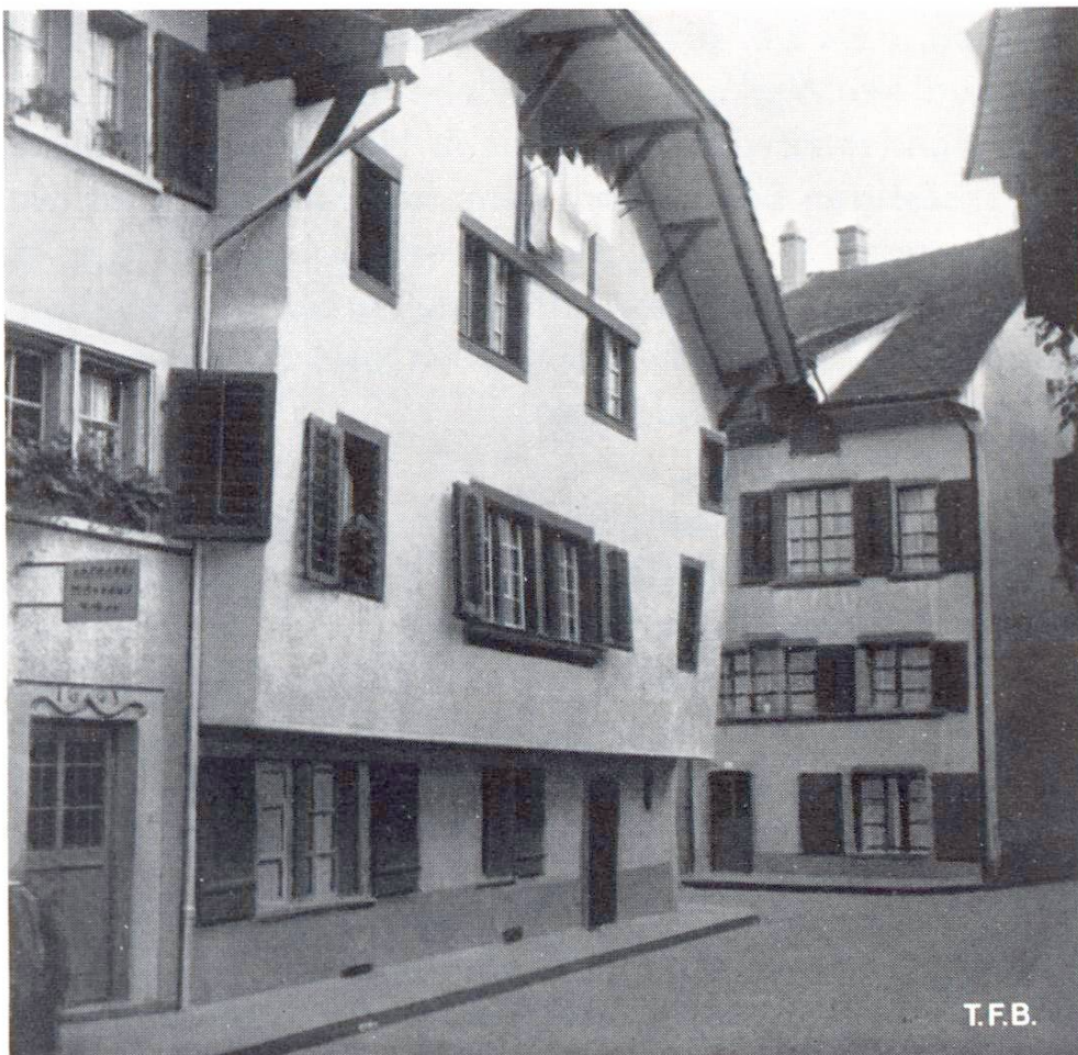
Abb. 4 Ein Haus, dessen obere Geschosse gegen die Strasse vorspringen. Auf diese Weise suchten die Bewohner sich oft aus ihrer grossen Raumnot etwas zu befreien. Dieses Gebäude scheint dadurch allerdings im Verlaufe der Zeit etwas aus dem Winkel aeraten zu sein.

Heute möchten wir hingegen zu einem gemütlichen Rundgang durch die Altstadt auffordern und, die alten Häuser, Gassen und Winkel betrachtend, die Gedanken verfolgen, die uns dabei etwa zurück in die alten Zeiten führen. Wir Baufachleute können uns auf die Geschichte unseres Handwerks besinnen und daraus vielleicht mancherlei Anregungen schöpfen. Auch werden wir, wenn wir uns in ein stilles schmales Gässchen verirren, für eine Weile dem Lärm und der Hast unserer Zeit entrissen und wir lernen die gemütvollere Seite der Altstadt kennen.