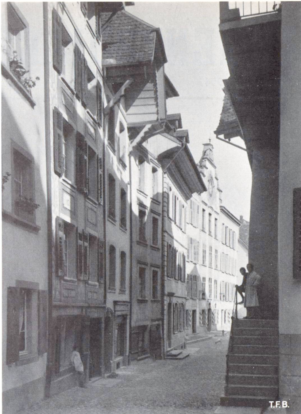
Abb. 2 Die kleinen Gässchen abseits des Durchgangsverkehrs sind am besten erhalten geblieben

Es gibt im Ausland noch einige wenige kleine Städtchen, welche sich, wie durch Zufall, in ihrer Form, ihren Bauwerken und ihrer Grösse seit ausgangs Mittelalter fast rein erhalten haben. Sie liegen abseits der alten Verkehrswege, Handel und Wandel blieb auf die nächste Umgebung beschränkt, die Entwicklung war in einem frühen Zeitpunkt stillgestanden. Vielleicht haben auch die ehemals mächtigen Zünfte, die mehr auf die Erhaltung des Bestehenden als auf die Einführung von Neuem bedacht waren, zum Dornröschenschlaf ihrer Städtchen beigetragen. Heute sind diese merkwürdigen Orte zu weltbekannten Sehenswürdigkeiten geworden. Es darf kaum mehr etwas an ihnen gerührt werden und selbst die Ein-