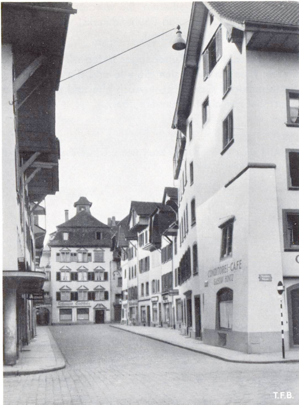
Abb. 3 Hohes Eckhaus mit mächtiger gekrönter Stützmauer. Im Hintergrund das erste Haus dieser Stadt, welches den gebräuchlichen spätgotischen Baustil durchbrach, erbaut ums Jahr 1700.

wohner kommen sich mitunter als Museumsstücke vor. Der Besucher wird von einem unwirklichen romantischen Zauber erfasst.