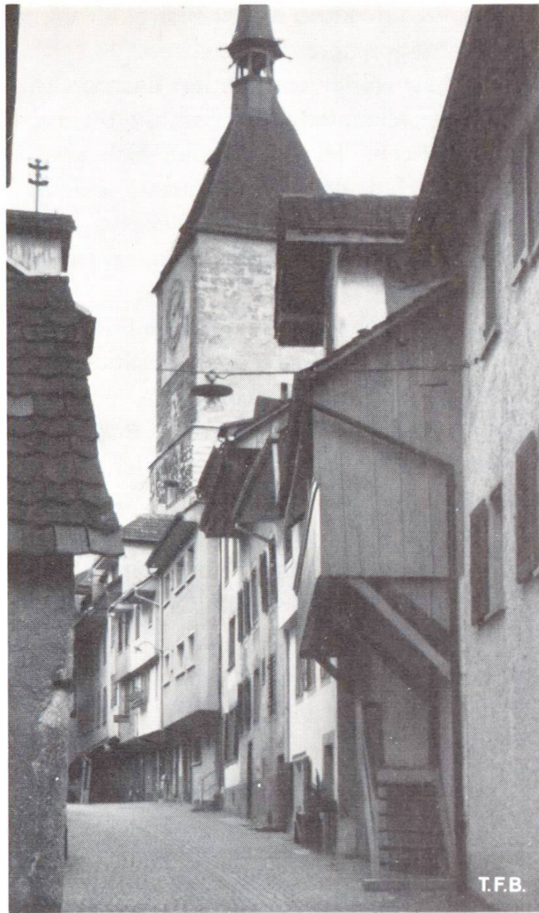
Abb. 5 Kleinere Häuser der Innenseite der Ringmauer angebaut. — Die Gasse führt hinauf zum einen Stadttor mit grossem Wehrturm.

Beginnen wir mit unserem Rundgang in der Hauptgasse. Sie ist breit angelegt, denn sie diente früher, vielleicht heute noch, dem allgemeinen Markt. Links und rechts stehen in geraden Reihen die grössten und schönsten Bürgerhäuser der Stadt. Die Erdgeschosse, wo sich ursprünglich Werkstätten und vereinzelt Stallungen befanden, erhielten Geschäftseinbauten, welche aber das Gesamtbild kaum stören. Die Hauptstrasse wird durch eine oder mehrere Nebengassen rechtwinklig geschnitten. Unten und oben wird (oder wurde) sie durch Stadttore mit ihren Wehrtürmen abgeschlossen. Dies alles ist planmässig und grosszügig angelegt —, tatsächlich, denn wir befinden uns in einer absichtlich gegründeten und in kurzer Zeit aufgebauten Stadt. Andere Orte, wie z. B. Zürich und