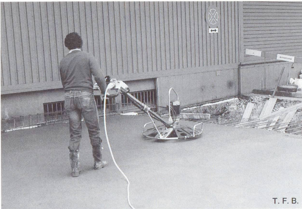
Abb. 3 Oberflächenfertigung. Hier: Abglätten mit Flügelglätter.