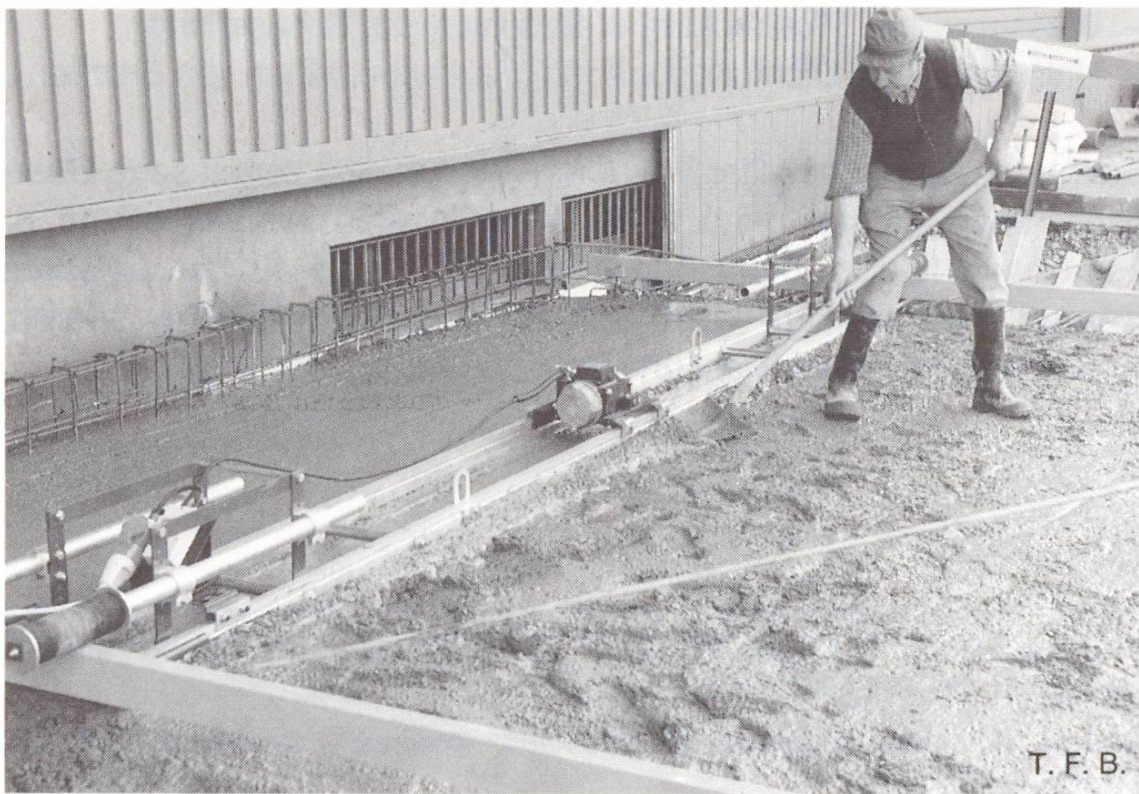
Abb. 1 Höhengenaues Abziehen mit Oberflächenvibrator.