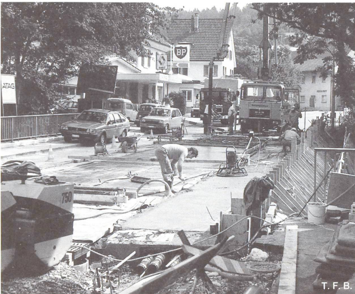
Abb. 5 Brücke über den Erzbach (AG/SO). Kantonsstrasse im Einbahnverkehr. Betonieren der 2. Etappe mit anschliessender Vakuumbehandlung.

phase keinesfalls mehr austrocknen, da er das verbleibende Wasser zur Hydratation benötigt. Die Nachbehandlung hat deshalb einzusetzen, sobald der Beton ansteift, d.h. trittfest ist. Verschiebt man sie auf den folgenden Tag, so kann es bereits zu spät sein (z.B. einsetzender Föhnwind während der Nacht). Geeignet ist das Abdecken mit Plastikfolien oder mit Isoliermatten. Bei Verwendung eines Curing compound ist nur ein gleichmässiges Aufbringen wirksam, was aus praktischen Gründen nicht immer durchführbar ist.