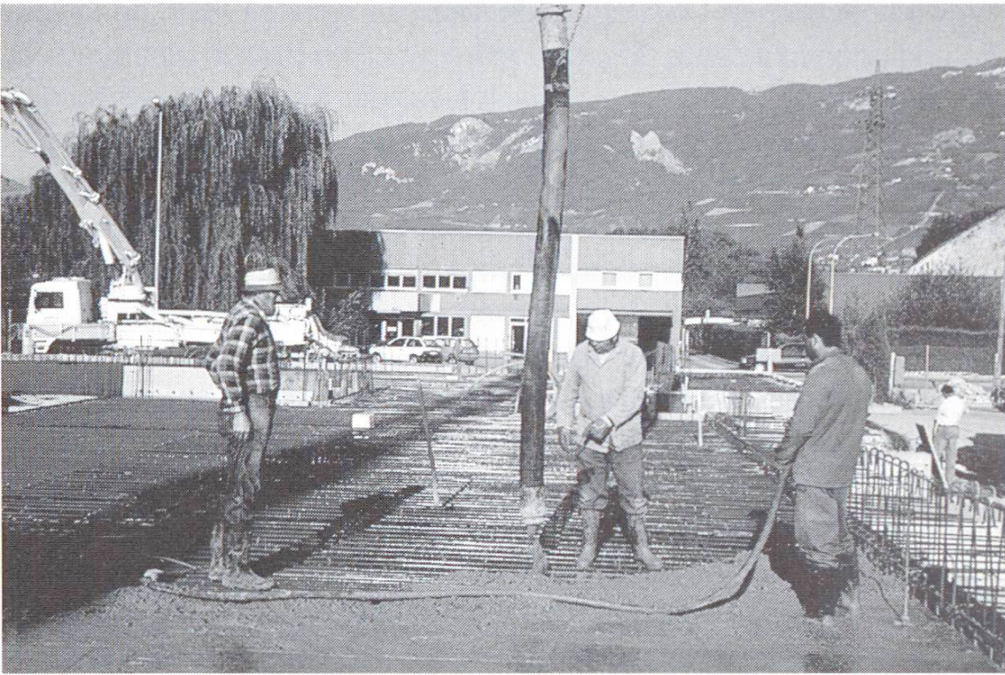
Betonieren der Bodenplatte einer Käserei. Der Beton wird bei beschichteten Bewehrungen wie bei normaler Bewehrung eingebracht.