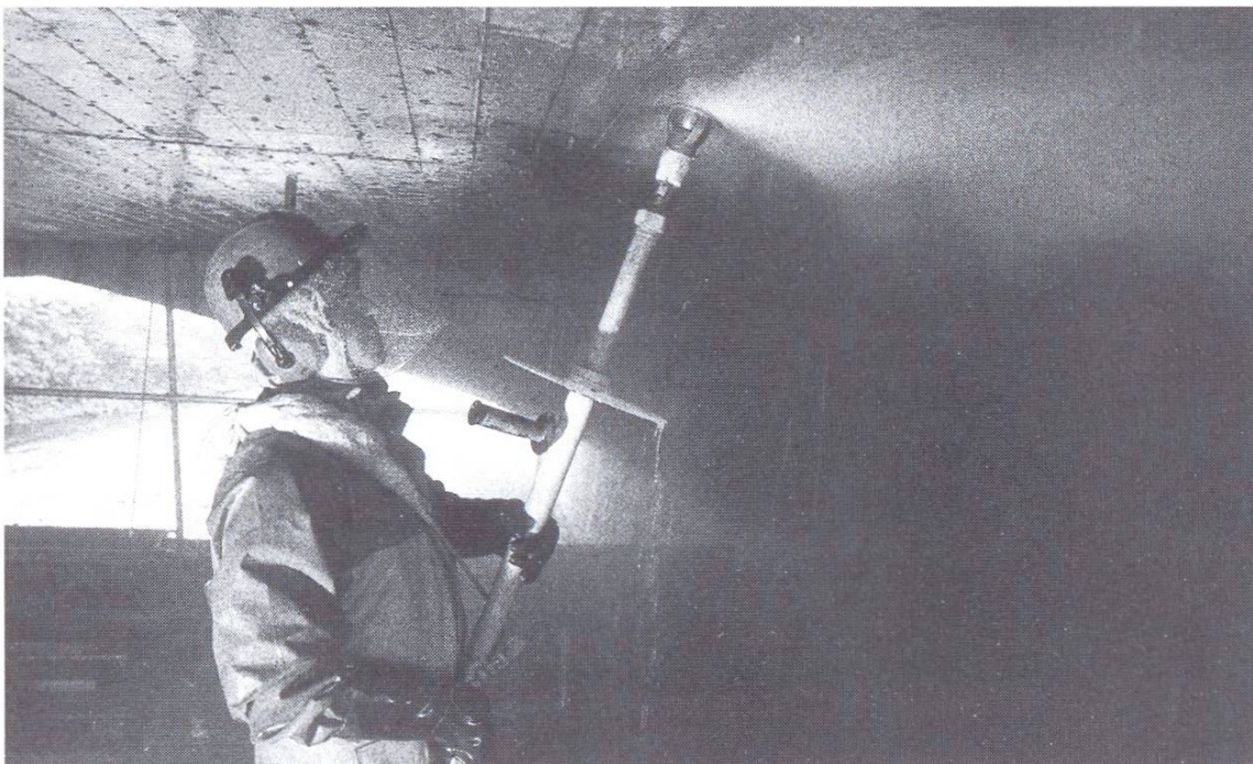
Abb. 2 Reinigung einer Brückenunterseite mittels einer Handlanze (1000 bar). Man beachte die umfangreichen Massnahmen zum Schutz des Arbeiters.

Ein letztes bedeutendes Einsatzgebiet des Druckwasserstrahlens ist das Reinigen von Oberflächen und das Entfernen von Beschichtungen. Zu diesem Zweck sind spezielle Flachdüsen und Antriebssysteme mit rotierenden Düsen auf dem Markt. Beim Druckwasserstrahlen werden fremde Materialien wie Schmutz entweder zerstört, oder die Haftung zwischen Fremdmaterial und Betonuntergrund wird aufgehoben. Als vorteilhaft hat sich beim Abtragen bestimmter