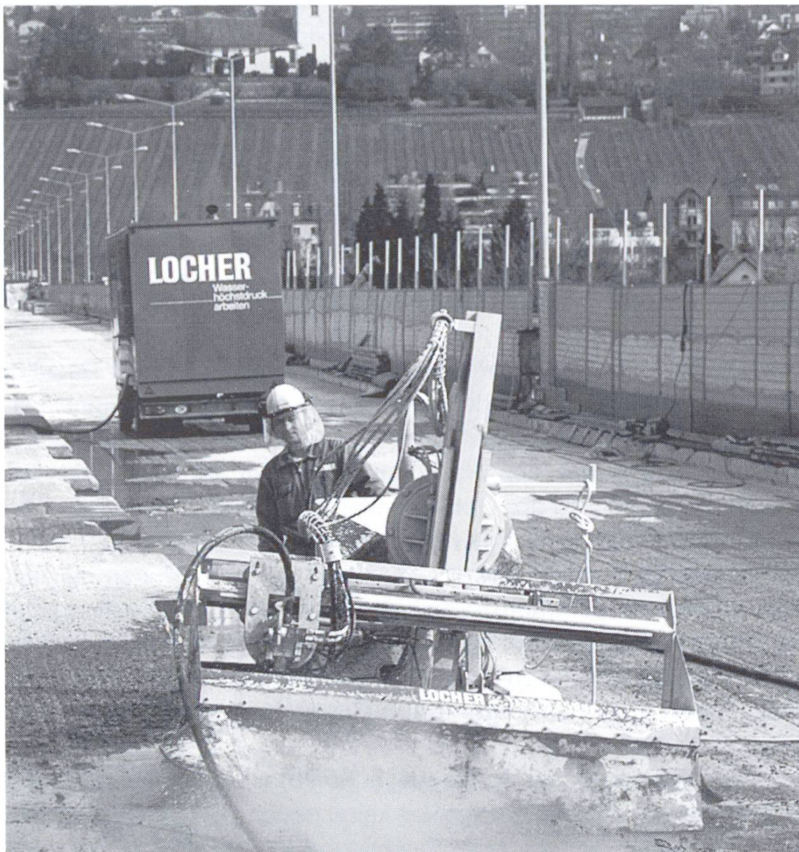
Abb. 4 Horizontaler Abtrag von Beton mit robotergesteuertem Höchstdruckwasserstrahlgerät (Druck 1000 bar, Volumenstrom 138 l/min).

Das Arbeiten mit Hoch- und Höchstdruckwasserstrahlgeräten ist nicht ohne Gefahren. Die Ekas [7] schreibt deshalb in ihren detaillierten Richtlinien vor, dass nur speziell ausgebildetes Personal eingesetzt werden darf. Verlangt werden auch nicht weiter definierte «geeignete persönliche Schutzmittel». Zudem sind im Umkreis von