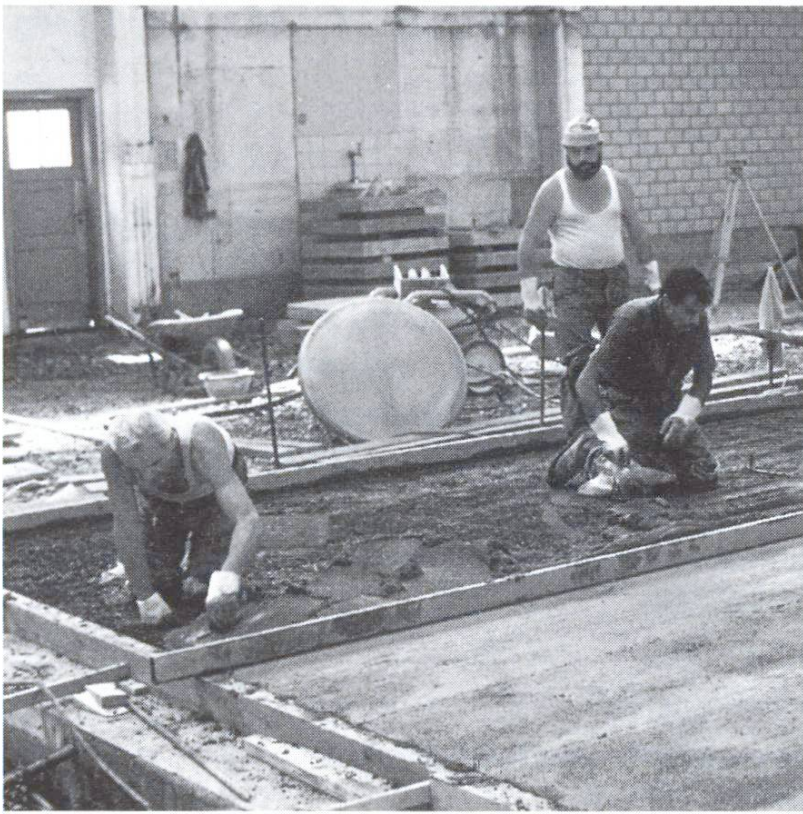
Sorgfältige Verarbeitung und Nachbehandlung – auch bei flüssigkeitsdichtem Beton zwei wichtige Bausteine zum Erfolg.