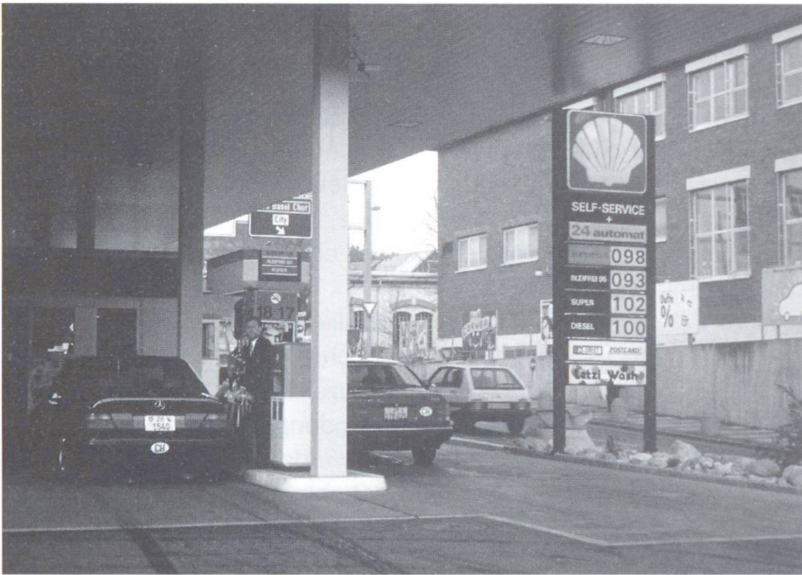
Bodenplatten aus Beton haben sich im Tankstellenbereich bewährt.