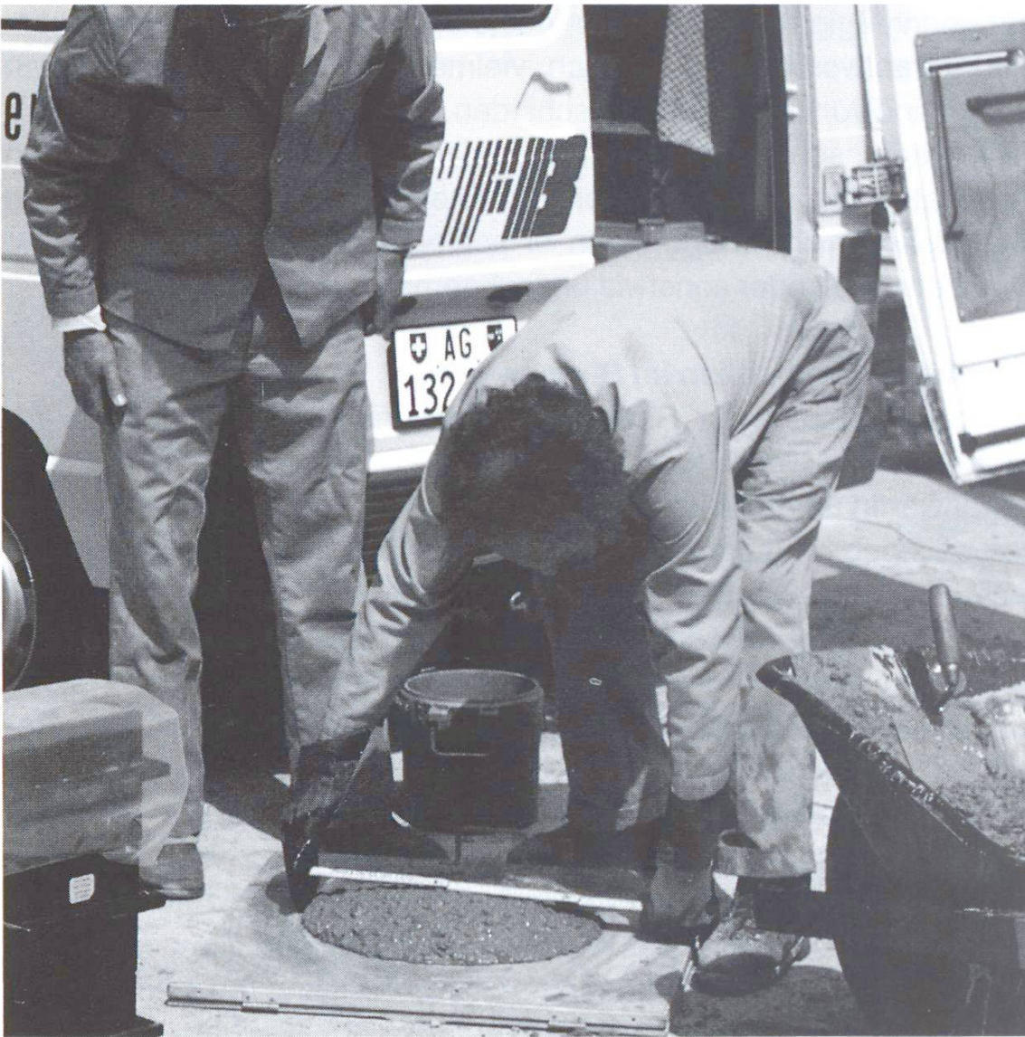
Bestimmung des Ausbreitmasses.

möglichst nahe am Verwendungsort des Betons zu prüfen. Als besonders nützlich hat sich auch die Kontrolle der Rohdichte erwiesen, da sie Änderungen des Luftporen- und Wassergehalts zuverlässig anzeigt ([6], Ziffer 3 183). Wie bereits erwähnt, muss der Luftporengehalt bei frost- bzw. frostausalzbeständigem Beton mehrmals täglich überprüft werden.