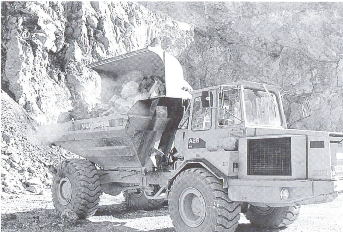
Muldenkipper zum Transport von Kalkstein.

Berater der TFB werden von Zeit zu Zeit mit Problemen konfrontiert, die auf Missverständnisse bei der Anwendung von Kalk zurückzuführen sind. Genauer ausgedrückt geht es darum, dass es sich bei den Bindemitteln, die im normalen Sprachgebrauch als «Kalk» bezeichnet werden, um recht unterschiedliche Produkte handeln kann [1]. In der Norm SIA 215 [2] wird zwischen hydraulischem Kalk und verschiedenen Formen von ungelöschtem und gelöschtem Weiss-