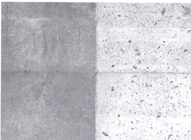
Einfluss wasserabführender Schalungsbahnen auf Betonoberfläche: rechts nicht saugende Schalung, links mit Zement-drain bespannte nicht saugende Schalung.

Schalbretter werden mit 3 bis 5 mm breiten Schlitten im Abstand von 10 cm versehen. Auf der dem Beton zugewandten Seite sind die Schalbretter mit einem synthetischen Gewebe hoher Reißfestigkeit und hoher Alkalibeständigkeit bespannt. Wasser und Luft können beim Betonieren und Verdichten durch die Schlitten entweichen, Zementteilchen und Mehlkorn nicht. Der Effekt ist bekannt: ein niedriger W/Z-Wert und damit bessere Qualität des Randbetons. Beim Vergleich mit konventionell hergestelltem Beton wurden folgende Vorteile festgestellt: weniger Lunker (oft vollständig lunkerfrei), 70 % höhere Druckfestigkeit des Randbetons, um den Faktor vier niedrigere Carbonatisierungstiefen, fünfmal niedrigere Chlorideindringtiefen sowie beträchtliche Steigerung der Frost-Tau-Beständigkeit. Die Betonoberfläche, auf der ein fein strukturierter Abdruck des Gewebes feststellbar ist, lässt sich mit geringerem Aufwand für das Aufbringen von Überzügen und Abdichtungen vorbereiten, deren Haftung verbessert ist.