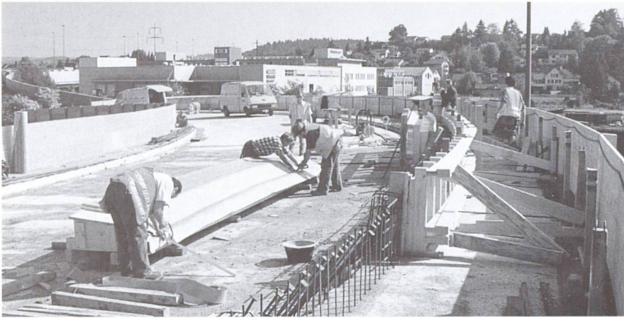
Bespannen von Brüstungselementen mit wasserab-führenden Schalungs-bahnen.