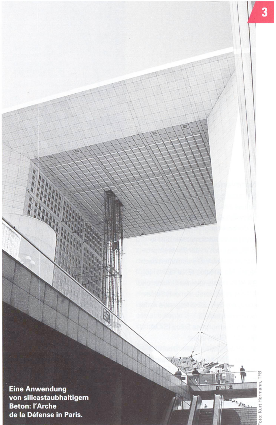
Eine Anwendung von silicastaubhaltigem Beton: l'Arche de la Défense in Paris.

Silicastaub (auch als Silica, Microsilica, Silica fume bekannt) entsteht als Nebenprodukt bei der Herstellung von Silizium und Siliziumlegierungen (Ferrosilizium): In Lichtbogen-schmelzöfen unvollständig re-