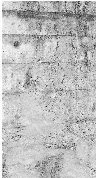
Wasserausscheidung aus einem Kiesnest.