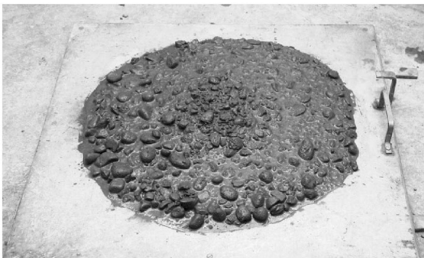
Blutender Beton auf dem Ausbreittisch.

Nach dem Einbringen und Verdichten sollten die Teilchen an Ort bleiben. Der sie umgebende Schmierfilm ist jedoch zu wenig stark, um die schwereren Zuschlagstoffe an Ort zu halten; sie sinken ab. Gleichzeitig steigt Wasser auf, das aus der Schmierschicht verdrängt worden ist. Diese Absetzbewegungen können durch Vibrieren oder Nachvibrieren unterbrochen werden. Beendet sind sie, wenn eine möglichst dichte Packung erreicht worden ist oder wenn der Beton eine Festigkeit um 0,1 N/mm 2 erreicht hat.