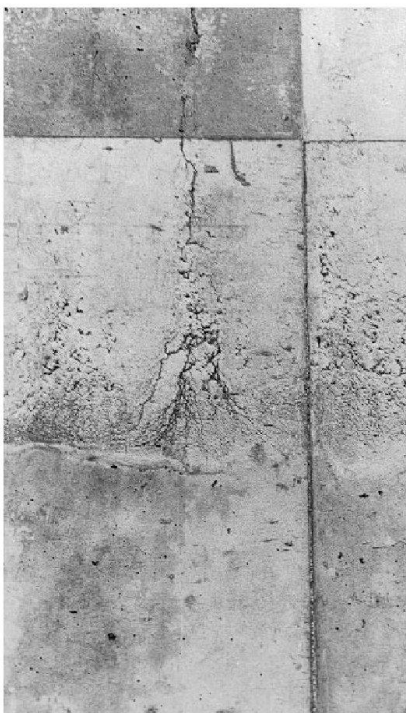
Wasserausscheidung im Bereich einer Betonierfuge.

Eine mögliche weitere Folge des Blutens ist das Auftreten von Kapillarschwindrissen [4]: Solange die Feststoffteilchen sich noch bewegen können, wird eine dem Wasserverlust entsprechende grössere Lagerungsdichte eingenommen; der Volumenverlust des Betons entspricht ungefähr dem Wasserverlust.