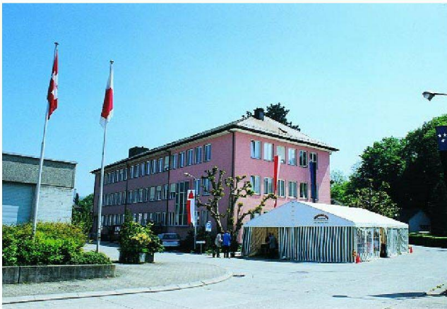
Ruhe vor dem Sturm.

Schätzungsweise 600 bis 800 Personen besuchten am 7. und 8. Mai 1999 die TFB in Wildegg. Herbert Odermatt war mit einer Kamera dabei.