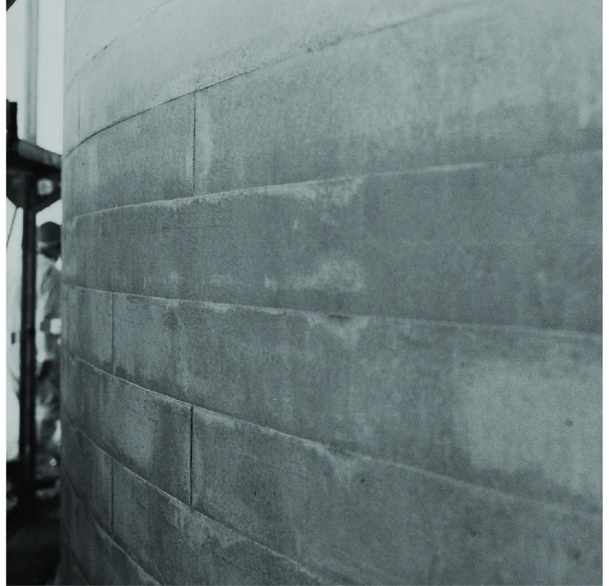
Die Spritzbetonoberfläche der gebogenen Wandfläche des Schiffs der Kirche St. Karl in Luzern wurde mit einer Schalbrettstruktur versehen.