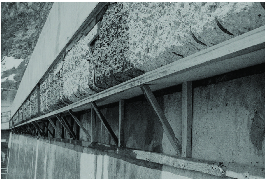
Geländerkonsole von Staumauerkrone, bereit zum Bespritzen (Altbeton abgespitzt, eingeschalt).

Die Verwendung von Sackware kann sich bei Instandsetzungsarbeiten lohnen und auch neue Möglichkeiten eröffnen. Unerfahrene Unternehmer, die glaubten, mit dem Kauf einer Spritzeinrichtung und von Fertigmischen sei es getan, haben aber viel Schaden angerichtet. Teichert meinte dazu [3]: «Bei Spritzarbeiten mit Sackware ist hierzulande einiges schief gegangen. Das hat den Spritzbeton wieder ins Gerede gebracht und mühsam ausgeräumte Zweifel oder Vorurteile neu erweckt.»