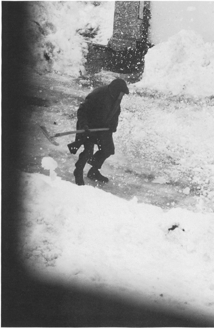
Bourrasque, Saignelégier Windstoss, Saignelégier