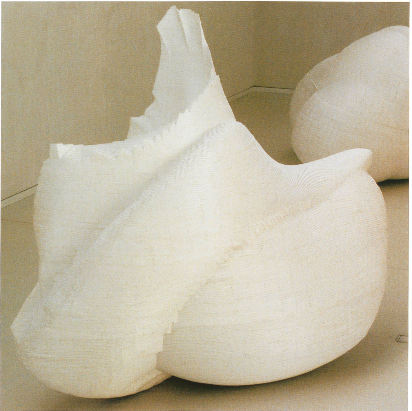
Seele S. R., Polystyren, 1997 280 × 130 × 240 cm