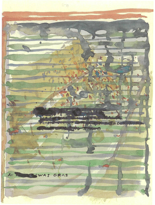
Flüssigprojekt 1, 1997 3-teilig, Tusche, Aquarell auf Papier, je 32×23,5 cm