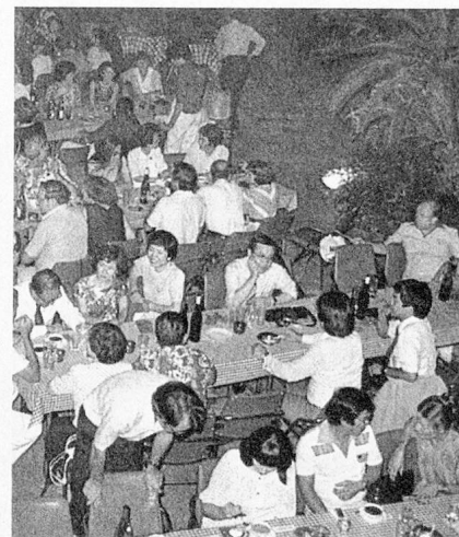
Photograph of 1st of August 1983

this year's spring event. It was a day full of fun, with a «sporty» picnic and numerous games. Many of us proved their topfitness or ... realized that rusty muscles needed oil!