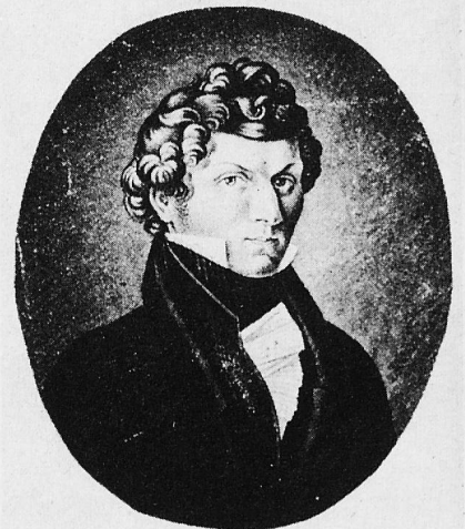
Peter Rindisbacher (1806-1834)