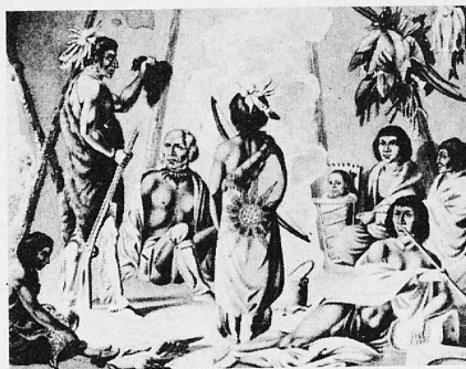
Scene in Indian tent (Collection West Point)

lowed him, Rindisbacher was an eyewitness of almost everything he depicted. On the Red River of the North in the vicinity of present-day Winnipeg and along the upper Mississippi River in Minnesota, Wisconsin and Illinois, he knew Cree, Chippewa, Assiniboine, Sioux, Winnebago, and Sauk and Fox Indians, as well as halfbloods and white fur traders, and in the 1820's he observed their ways of wilderness life at first hand.