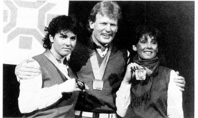
On 16th February 1984, Switzerland won three medals on one day: from left to right: Michela Figini (gold, women's descent), Peter Müller (silver, men's descent), Maria Walliser (silver, women's descent).