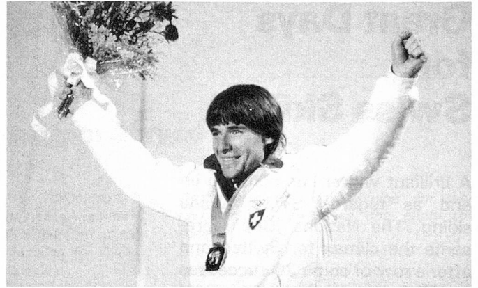
Max Julen, first gold medal of the Winter Games. He won it in the men's giant slalom.