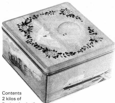
Contents 2 kilos of Basler «Leckerli»

We are looking forward to sending you quite soon sweet greetings from Basle.