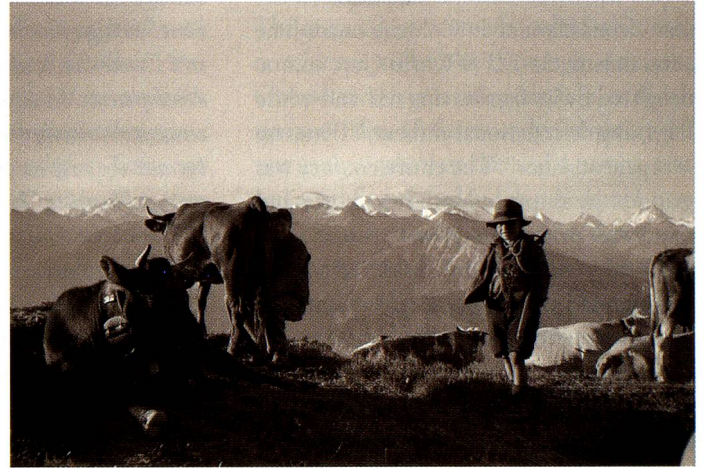
On the Varneralp, around 1945