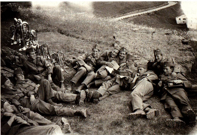
The break, spring 1940