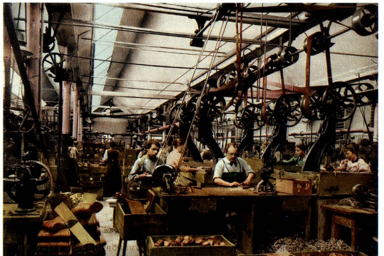
The carpentry workshop of the C. F. Bally shoe factory in Schönenwerd, circa 1900