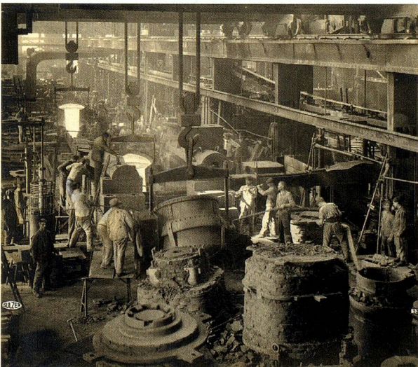
The Sulzer foundry in Winterthur, 1919