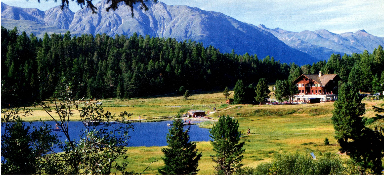
Hotel Lej da Staz, Lake Staz, St. Moritz