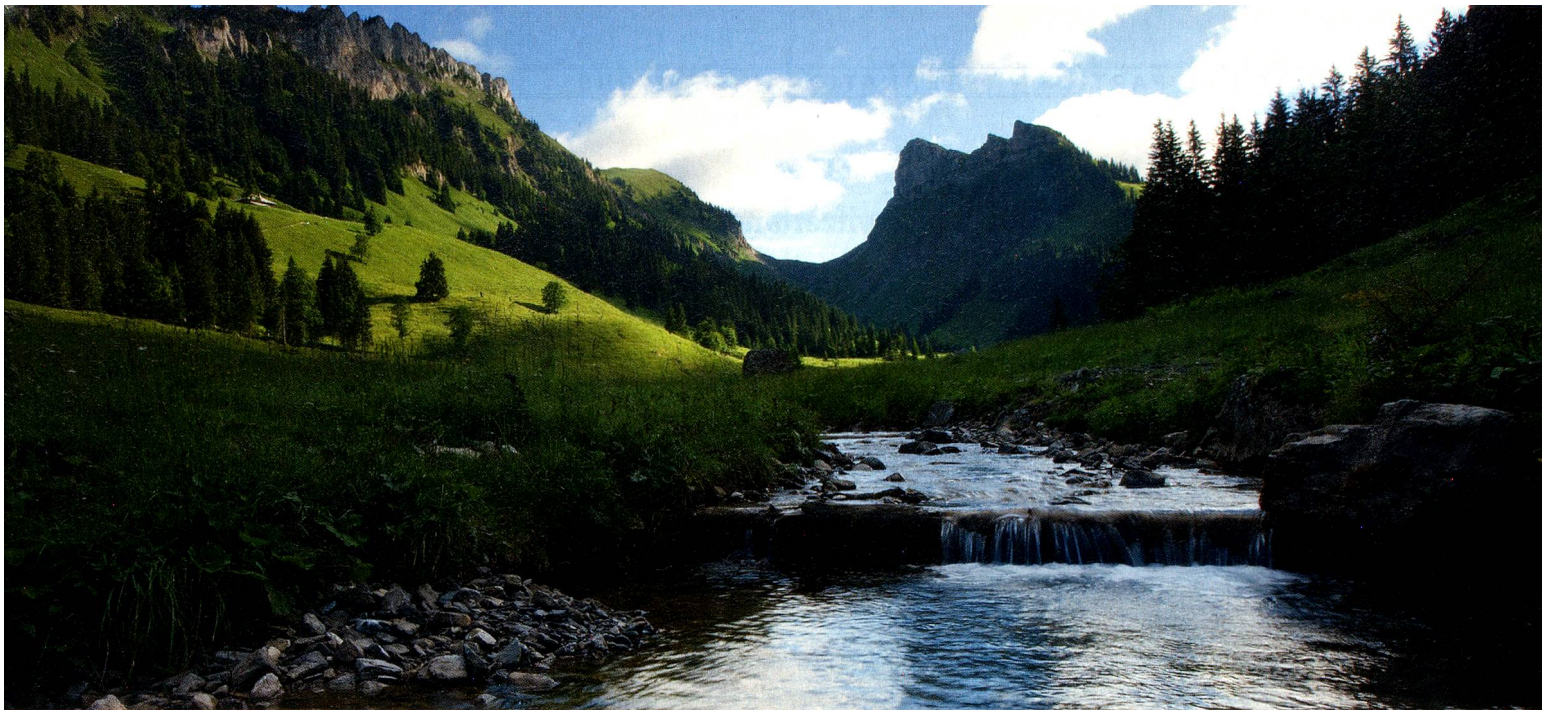
Justistal, the Thunersee-Hohgant Nature Park, Bernese Oberland