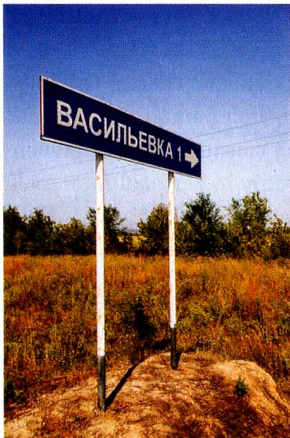
Basel, now Vasilyevka: Russia Founded: 20 August 1767 Population when founded: 166 Neighbouring villages on the Volga: Glarus, Lucerne, Zug, Schaffhausen, Unterwalden, Solothurn, Zurich, all founded 1767/1768