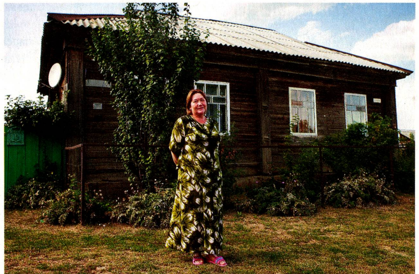
Zurichtal, now Zolotoe Pole: Ukraine Founded: September 1805 Population: 4,000 Inhabitants: Ukrainians, Russians, Crimean Tatars