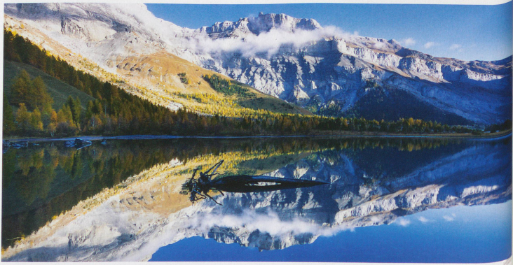
Lac de Derborence in the canton of Valais with the Tour Saint-Martin crag, also known as the Quille du Diable (Devil's Skittle)