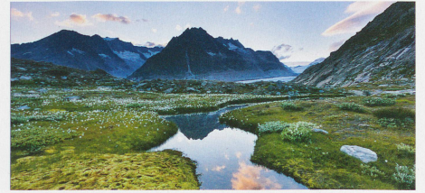
The tributary that flows into the Märjelensee at the edge of the Great Aletsch Glacier in the canton of Valais