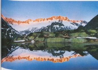
Göscheneralp in the canton of Uri with the peaks of the Damma mountains in the background