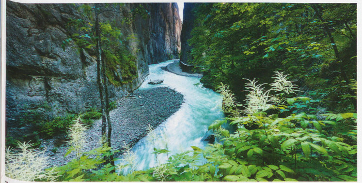
The Aare Gorge between Meiringen and Innerktirchen in the canton of Berne