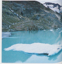
The Gault Glacier in the canton of Berne and in the background the Bäglistock bathed in the morning light