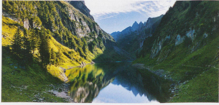
The Filensee in the canton of Appenzel innerrhoden with the peak of the Altmann in the background