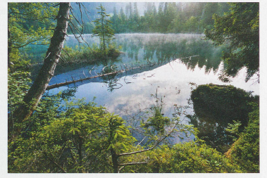
The Crestasee near Flims in the canton of Grisons