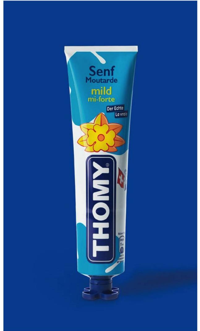
The Swiss businessman Hans Thomi was the first to put mustard into aluminium tubes in 1934 for a better shelf life.