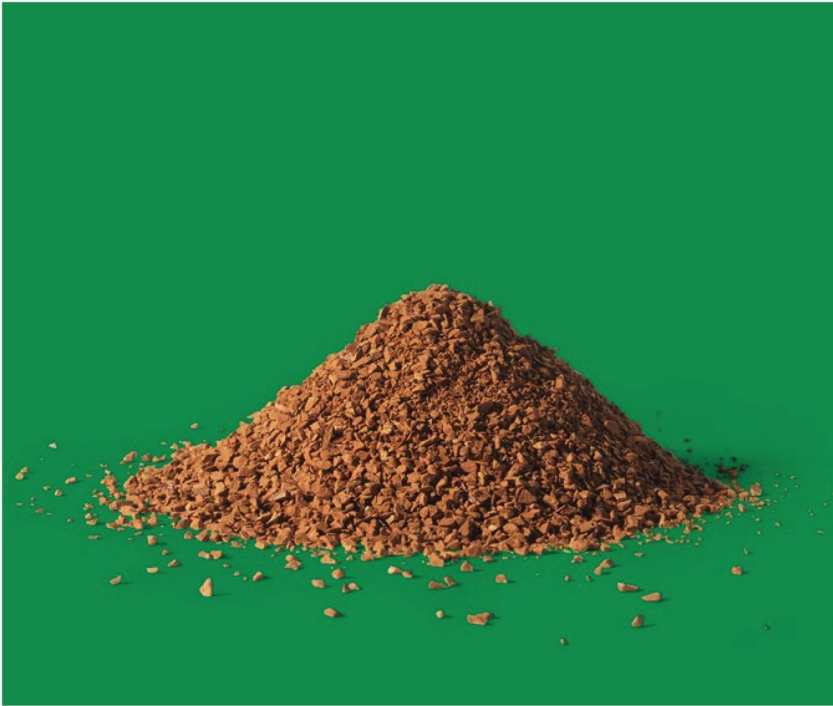
Instant coffee in powder form is a Swiss invention. Nestlé launched the first coffee in a tin in 1938.