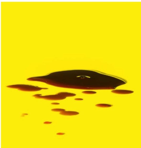
Having originally focussed on instant soups, Julius Maggi from Frauenfeld invented liquid seasoning in 1886.