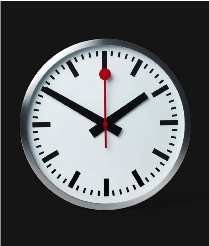
The Swiss engineer Hans Hilfiker invented the famous railway station clock, powered by electricity and synchronised every minute via the telephone line, in 1944.