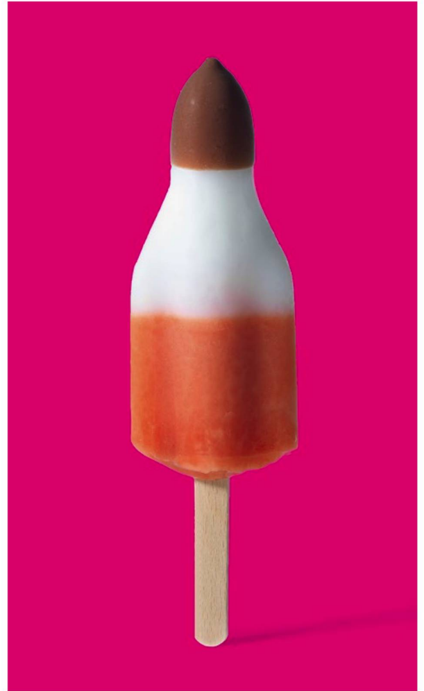
“Die Rakete” (The Rocket) – the classic Swiss ice lolly – was created after the first moon landing in 1969 and around eight million are still sold each year.