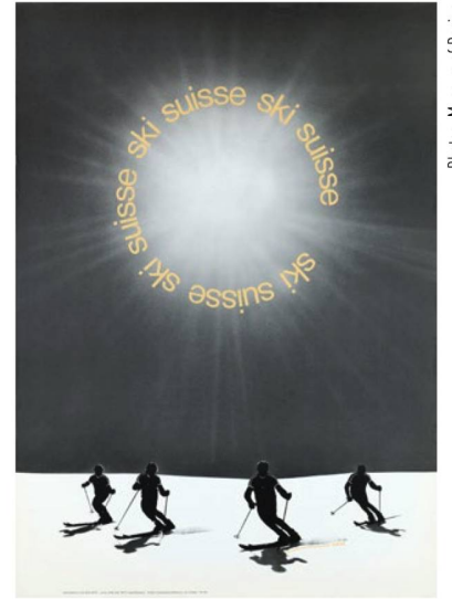
"Skiing in Switzerland", 1971