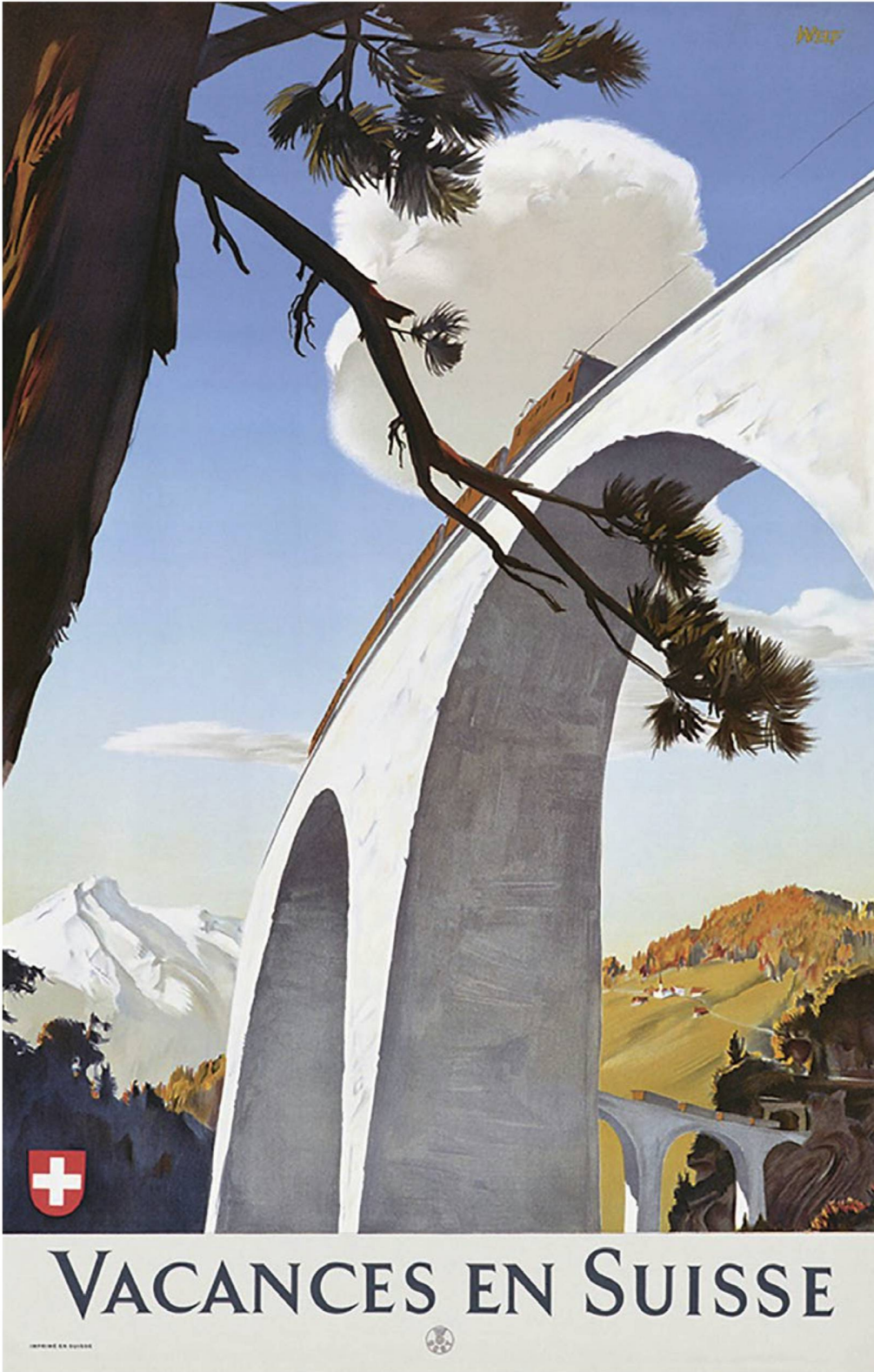
"Holidays in Switzerland", 1946.