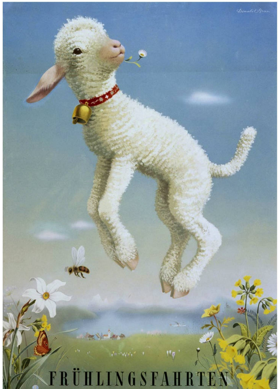
"Springtime trips", 1945