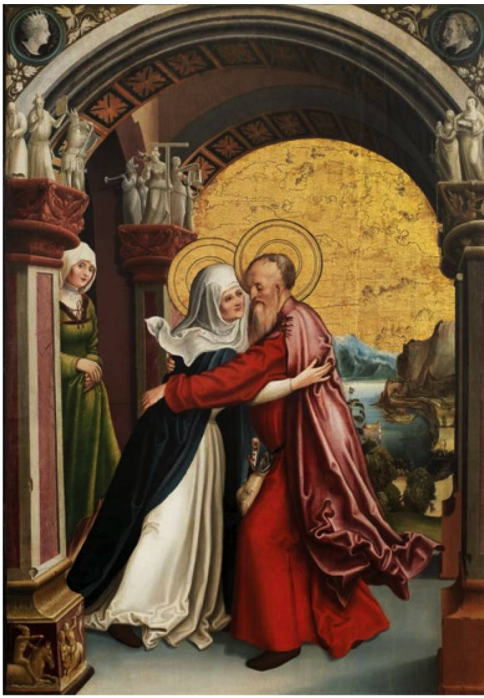
Niklaus Manuel: "Altar of Saint Anne: Joachim and Anne Meeting at the Golden Gate", 1515