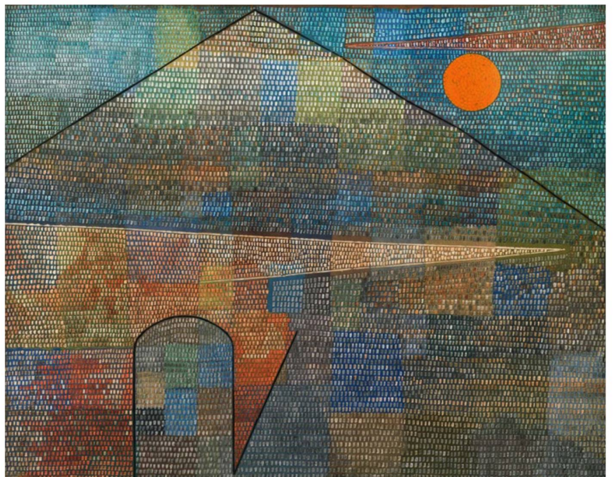
Paul Klee: "Ad Parnassum", 1932

Museum of Fine Arts Berne Hodlerstrasse 8–12, 3011 Berne Open from Tuesday to Sunday. www.kunstmuseumbern.ch