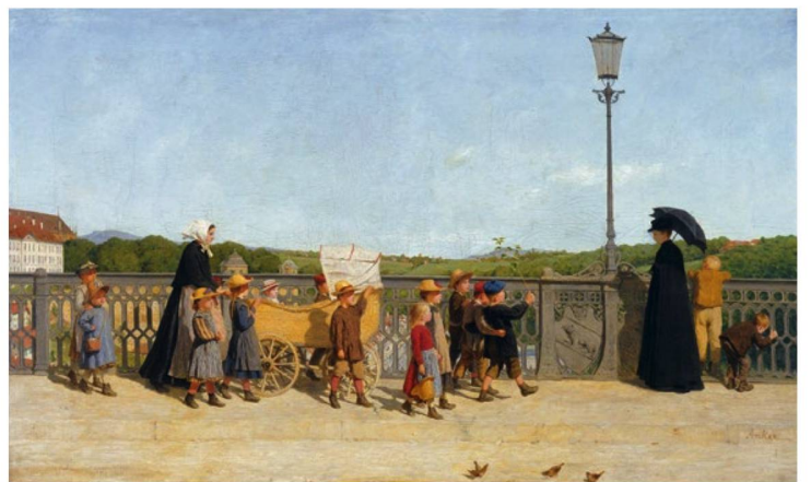
Albert Anker: "Infant School on the Kirchenfeld Bridge", 1900