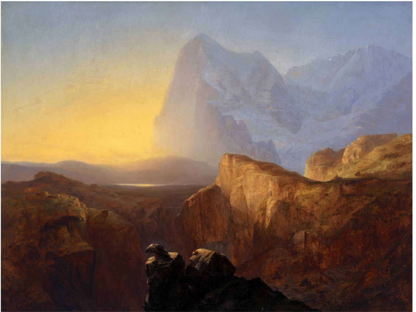
Alexandre Calame: "The Grand Eiger at Sunrise", 1844