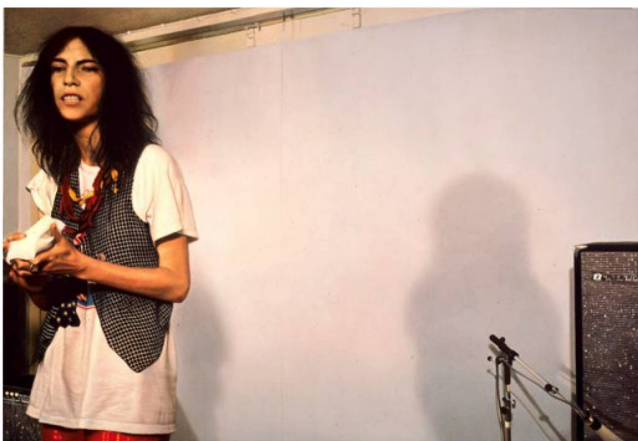
Franz Gertsch: "Patti Smith II", 1978