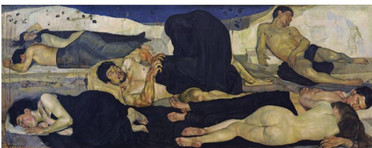
Ferdinand Hodler: "The Night", 1889