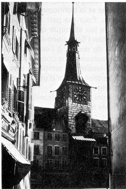
La Tour de l'Horloge à Soleure

Le Jura est une région truffée de châteaux. Et les armoiries des nobles d'autrefois, on les retrouve aujourd'hui reprises par les communes et les districts. Par ailleurs, on ne considère plus désormais les domaines seigneuriaux comme des marques laissées par des occupants, mais bien plutôt comme