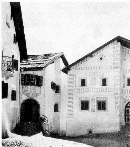
Maisons typiques à Guarda

causée par la situation économique, de nombreux citoyens rhéto-romans depuis le XVII e siècle (tout d'abord à l'étranger puis dans les grandes agglomérations de Suisse alémanique), ainsi que l'arrivée d'éléments parlant d'autres langues et ne cherchant guère à s'adapter, ont nui à la langue rhéto-romane. C'est la raison pour laquelle il est devenu nécessaire de protéger tout spécialement cette belle langue, fille du latin, dont les cinq patois n'ont pas pu être amalgamés en une langue