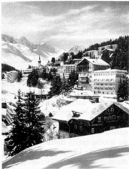
Arosa, l'un des centres sportifs des Grisons