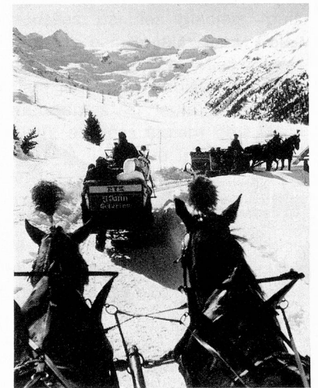
Promenades en traîneau dans le val Roseg, près de Pontresina, à l'arrière plan le massif de la Bernina