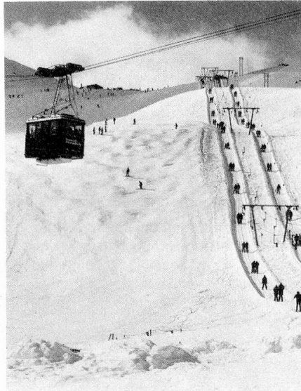
Pistes de ski de la région du Parsenn, près de Davos

De superbes forêts, des montagnes couvertes de glaciers, des