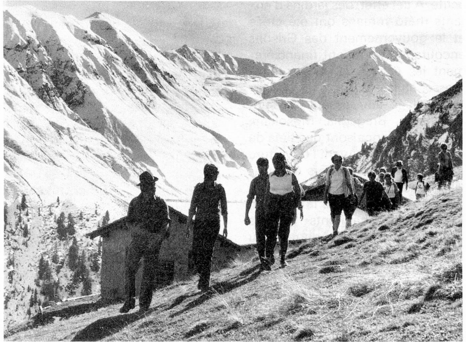
L'alpe de Vaüglia dans le Parc national

Au cours des dernières décennies, l'industrie s'est infiltrée de plus en plus dans certaines régions. Le plus grand complexe industriel des Grisons est constitué par la fabrique de produits chimiques et fibres synthétiques d'Ems (Emser Werke). L'eau est utilisée au maxi-