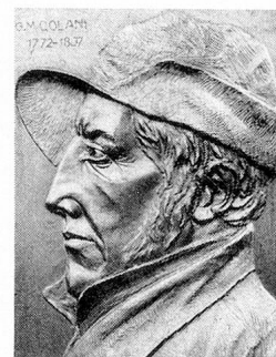
Tête de chasseur

Les Grisons (en langue rhéto-romane: Grischun, en italien: Grigioni, en allemand: Graubün-