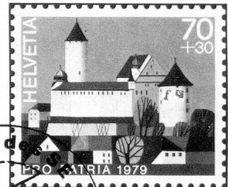
Château de Porrentruy